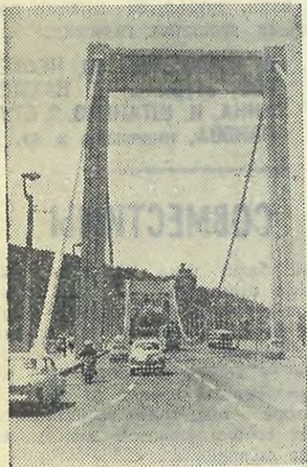
Гордость Будапешта — подвесной мост через Дунай.