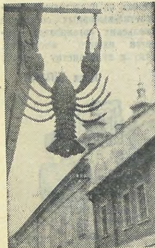
Оригинальная вывеска столовой.

ЛЕТОМ этого года небольшая группа политехников в 20 человек была направлена на международную студенческую стройку в Венгрию. Нас было много, желавших поехать, нас было мало поехавших. И багаж мы взяли немудреный: самое необходимое для работы, отдыха, предстоящих встреч — одна гитара, двадцать здоровых глоток и огромное желание каждого больше увидеть, больше рассказать самому.