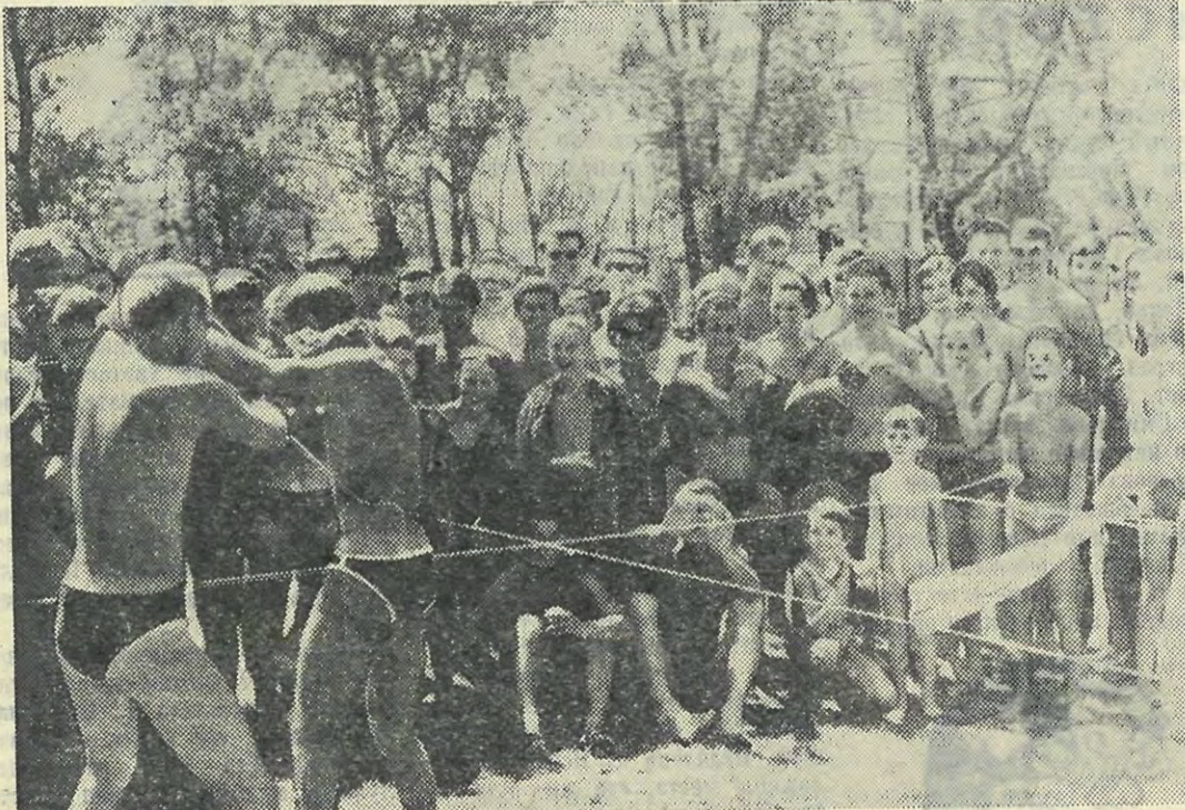
Развлекаем и развлекаемся сами.

Дружба наша с венгерскими друзьями продолжает расти. В начале сентября в СССР приехала группа венгерских студентов — организаторов международных строек. Несколько дней, проведенных в Ленинграде, быстро промелькнули для них. Экскурсии в Петродворец, Эрмитаж, по городу, в которых венгров сопровождали наши ребята, запомнятся им надолго. И вот 15 сентября. Прощальный вечер в кафе «Гренада», музыка, танцы. Мы проводили их в тепер уже хорошо знакомый нам Будапешт.