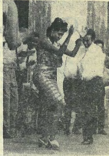
Студенты из Сомали исполняют свой национальный танец.