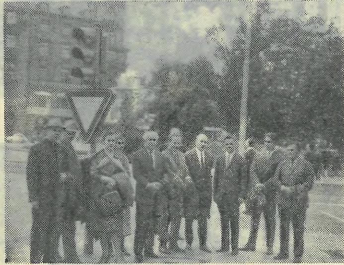
Наша делегация в ФРГ.