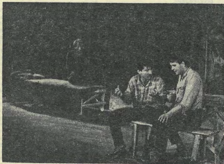
«Люди и мыши».