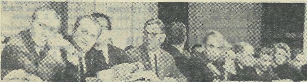
В президиуме торжественного собрания.

— С большим удовольствием и радостью выполняю я поручение студентов и профессорско-препо- давательского состава Корабле- строения института, — гово- рит он, — который направил ме- ня, чтобы поздравить ваш кол- лектив с высокой наградой и за- личить адрес.