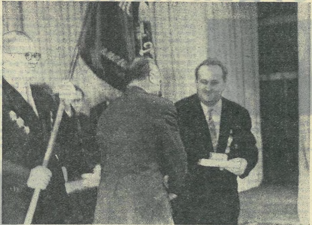
Орден Ленина приколот к знамени института. Секретарь Го- родского комитета КПСС Ю. И. Заварухин поздравляет ректора ЛПИ В. С. Смирнова с наградой.

На трибуне его сменяет ми- нистр высшего и среднего спе- циального образования РСФСР В. Н. Столетов. От имени колле- гии министерства и себя лично он горячо поздравляет коллектив с высокой правительственной награ- дой.