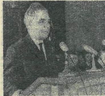
Выступает министр выше- го и среднего специального обра- зования РСФСР В. Н. Столетов.

Политехнический институт — это вуз-лаборатория, в которой разрабатывается подготовка дея- тельных специалистов. В послед- ние годы по инициативе инсти- тута, при поддержке Министер- ства высшего и среднего спе- циального образования был разрабо- тан план по укрупненным спе- циальностям. По этому плану мо- лодой специалист получает широкое образование.