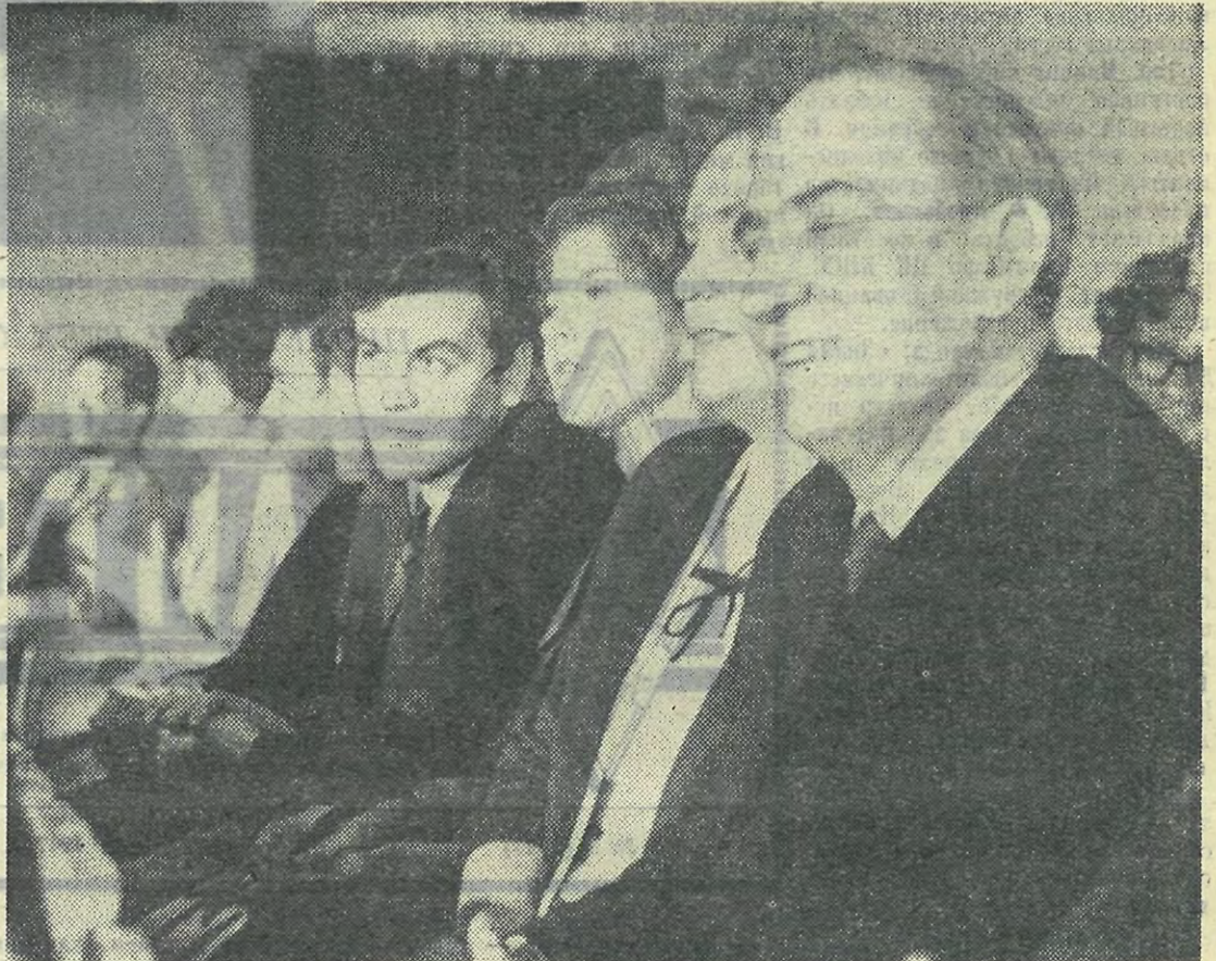
В зале Выборгского Дворца культуры.