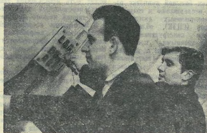
Фото и текст Н. Артемовой

Интересно проходят лабораторные работы на кафедре измерительной техники.