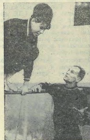
«Ну, видишь, так получается гораздо изящнее».

В 1968 году, как сообщает А. Б. Воробьев, кухонная посуда будет обновлена; кроме того, требовательность к факультетам в сохранности посуды будет повышена.