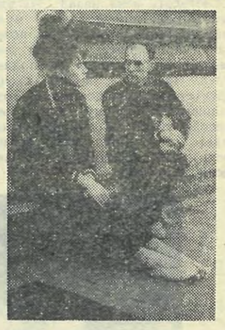
«На сегодня хватит. Отдыхай».