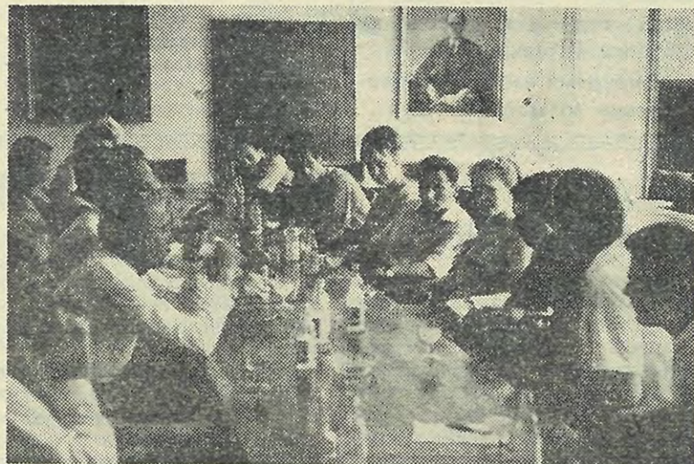
Встреча нашей делегации с руководителями ССНМ Дрезденского Технического университета.

Им установлен памятник в центре залитого солнцем двора. Пять скорбных фигур напоминают об их подвиге. А вокруг поднялись корпуса возрожденного университета, бурлит новая жизнь.