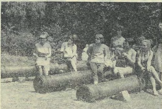
Пушки Кенигштейна не сделали за свою историю ни одного выстрела.