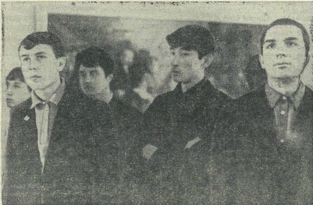
НА СНИМКЕ: группа студентов-политехников осматривает экспонаты в Музее В. И. Ленина на Болотной улице.

председатель историко-революционной комиссии при совете старых коммунистов Выборгского района, к. и. н., член КПСС с 1918 г.