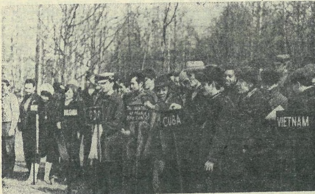
Воскресник окончен. Линейка, на которой всем землячествам вручены Почетные грамоты.