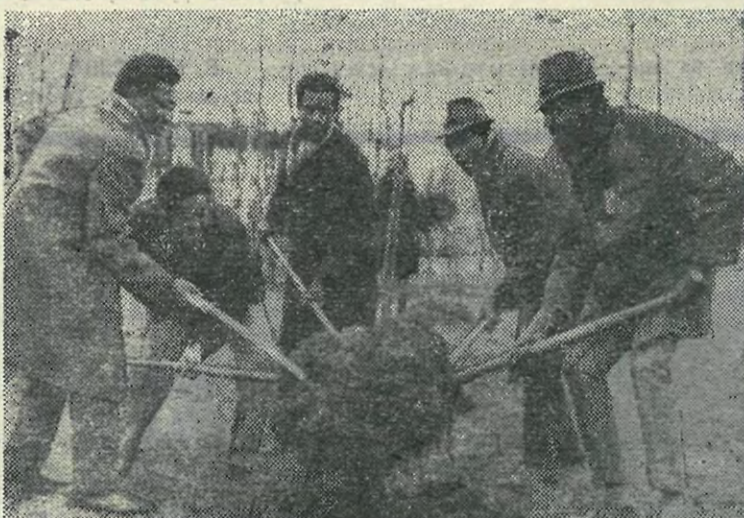
Студенты из Африки.