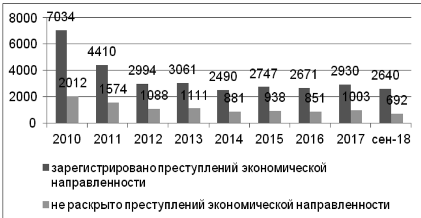
Рис. 4.4. Количество зарегистрированных преступлений экономической направленности, в том числе не раскрытых в Санкт-Петербурге за период 2010 – сентябрь 2018 гг. [4]