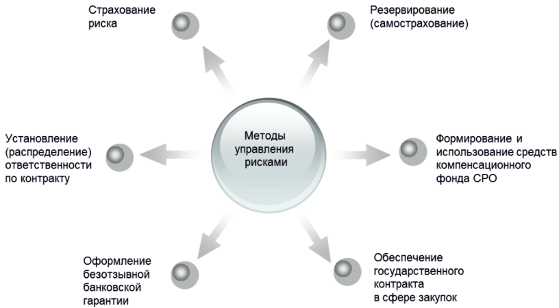
Рис. 1.3. Способы воздействия на риск проекта

В мировой практике, как правило, используют либо систему страхования ответственности и риска, либо резервирование средств (самострахование) в размере, необходимом и достаточном для покрытия ожидаемого ущерба (убытков). Компенсационный фонд саморегулируемых или иных некоммерческих организаций в указанных целях не формируется и не используется.