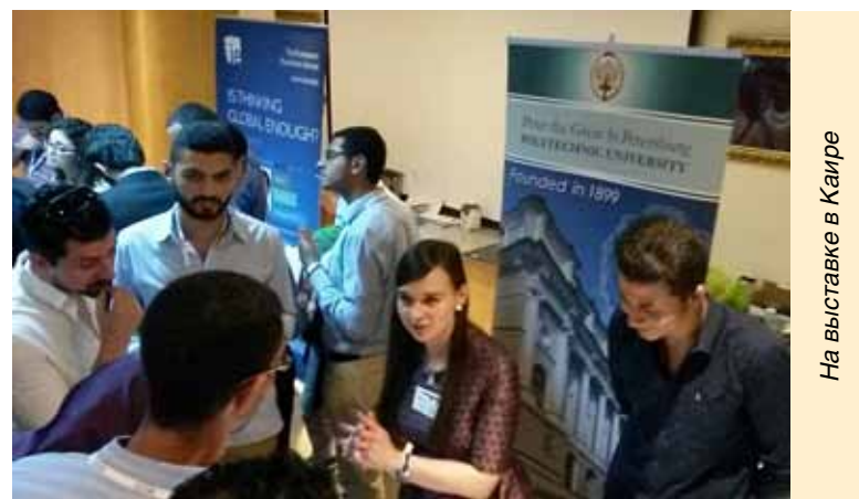
На выставке в Каире

В общем, наибольший интерес у посетителей вызвали междуна-