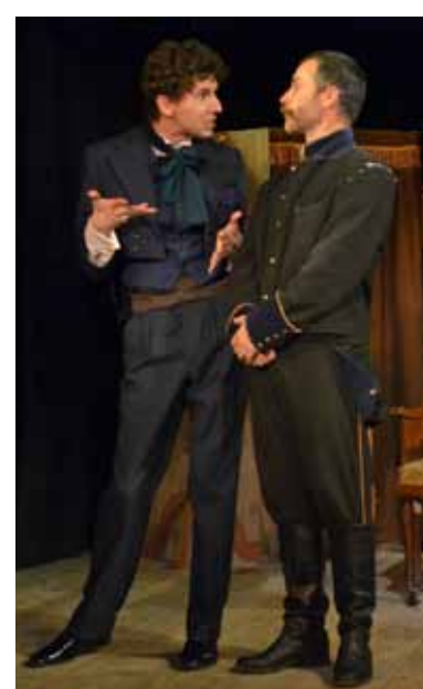
Женитьба Н. Комаров ????

Учредитель газеты: ФГАОУ ВО «СПБПУ» Газета зарегистрирована исполкомом Ленинградского горсовета народных депутатов 21.01.91 г. № 000255