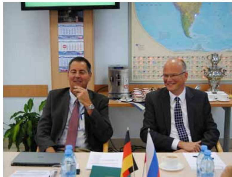
Представители ТУ Мюнхена на встрече в СПбПУ

Сотрудничество СПбПУ с компанией началось в 1995 г.