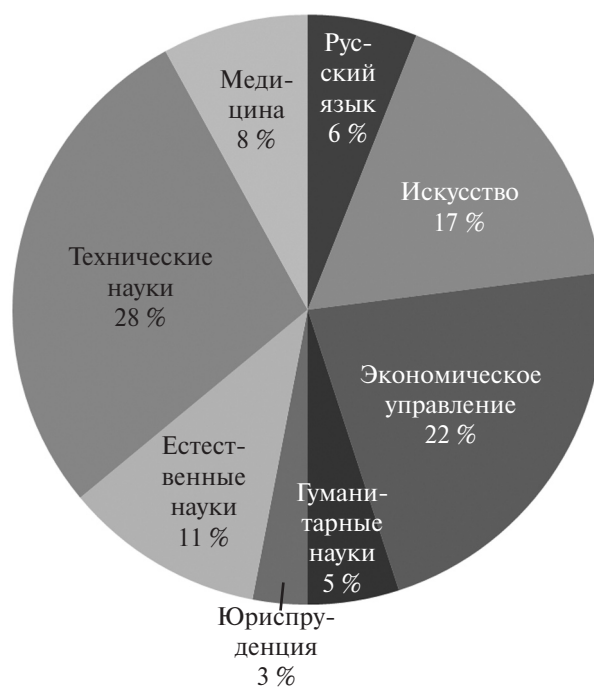
Рис. 1. Распределение специальностей по совместным образовательным программам китайских университетов и российских вузов

Подробная ситуация представлена на рис. 1–3.