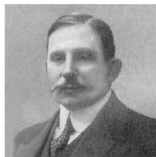
Франц Юльевич Левинсон-Лессинг (1861–1939)

Сведения о происхождении и семейном положении Ф.Ю. Левинсона-Лессинга содержатся в документах его личного дела советского периода, хранящегося в архиве Политехнического университета.