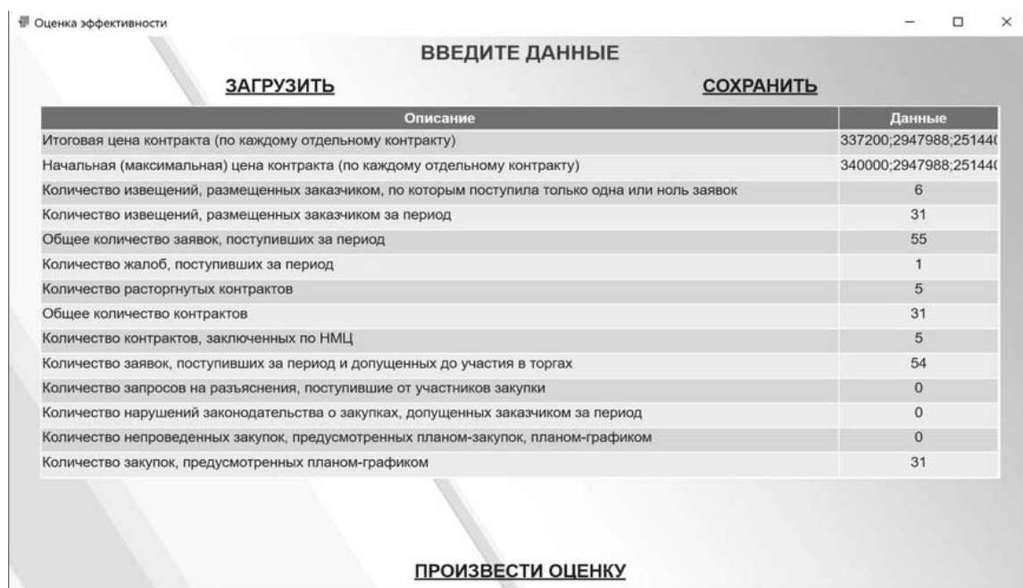
Рис. 2. Окно ввода данных Fig. 2. The data entry window

По результатам поиска отбираем контракты с реквизитами заказа «Электронный аукцион» (см. рис. 4). В данном случае закупка у единственного поставщика нас не