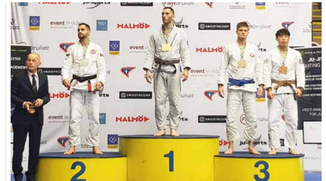
Выпускник Политеха выиграл золото и титул лучшего бойца