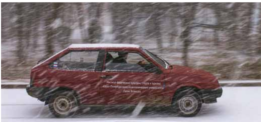
В этот раз зима подобралась совсем близко

В командном зачёте на высшую ступеньку поднялась детско-юношеская команда «Мотор», вторые – политехники КСТТ «Экстрим».