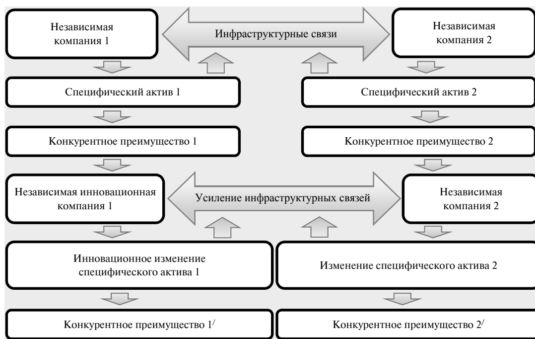
Рис. 3. Влияние инновационных изменений на конкурентоспособность независимых организаций, входящих в кластер