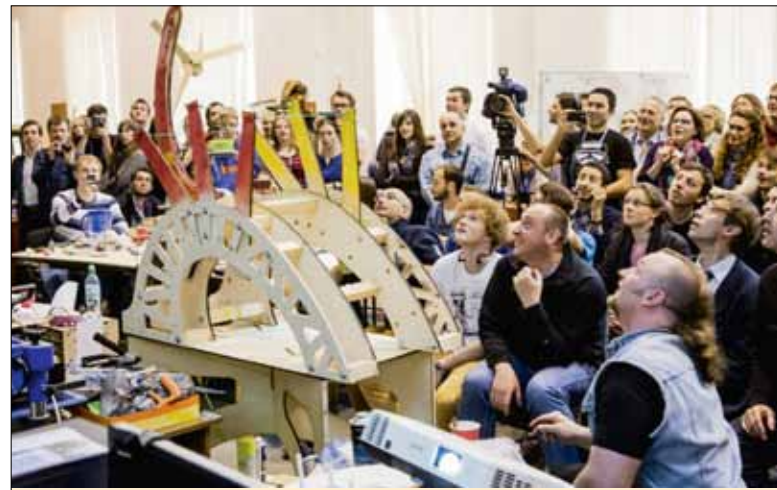
Запуск катапульты в Международной школе Фаблаб Политех

тацией экспертов, участвовать в тренингах, семинарах и мастер-классах. Кроме того, авторы обзаведутся рабочим местом в Коворкинге ПолиТех и узнают, как финансировать свои проекты.