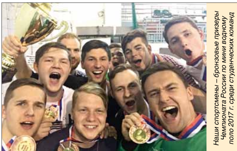
Наши спортсмены – бронзовые призеры Чемпионата России по мини-водному поло 2017 г. среди студенческих команд

«Политехник» является настоящей семьей, которая поддержи-