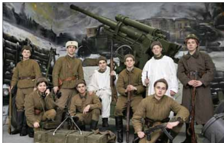
Панорама «Оборона Ленинграда» – один из проектов центра

Социальные сети: vk.com/patrioticcenter, facebook.com/patrioticcenter, telegram.me/nashpolytech, twitter.com/patriotismSPbPU, instagram.com/patriotismSPbPU, youtube.com/channel/UCvdXFGFyZQWJtNd15mg26-g.