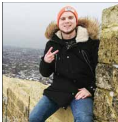
Дербент. В крепости Нарин-Кала

Про авиастоп знают все. А про авиастоп слышали? Вот и я только перед Новым годом узнал, что бесплатно и самолетом можно летать. Про такой вид путешествия объявила авиакомпания «Победа». По правилам акции до 10 января все пассажиры в костюмах Деда Мороза и Снегурочки смогут беспрепятственно отправляться любым рейсом. Но... при условии, если на борту лайнера будут свободные места.