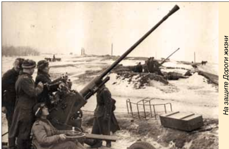
На защите Дороги жизни

В этом году Санкт-Петербург вместе со всей Россией отмечает 75-летие прорыва блокады Ленинграда. 18 января 1943 г. Красная армия пробилась узким коридором через вражеское кольцо и установила связь осажденного города с большой землей. А через год, 27 января 1944 г., блокада была полностью снята и враг отступил.