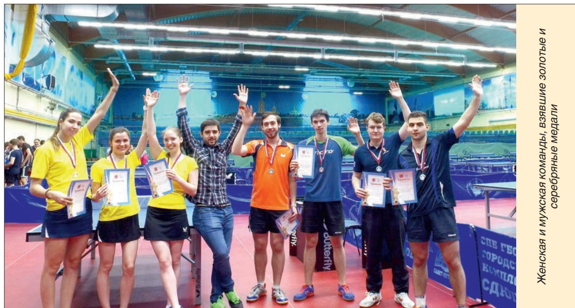
Женская и мужская команды, взявшие золотые и серебряные медали