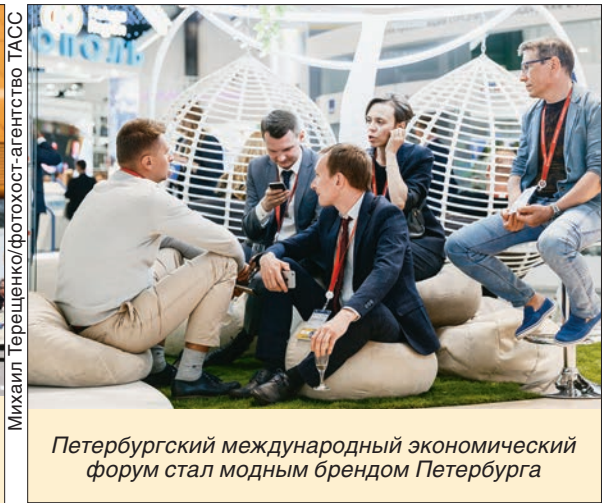
Петербургский международный экономический форум стал модным брендом Петербурга

ученых, мы предоставляем инструменты, чтобы они в полной мере подготовились к развитию цифровой экономики, – отметил член Правления «Сименс АГ» Роланд Буш.