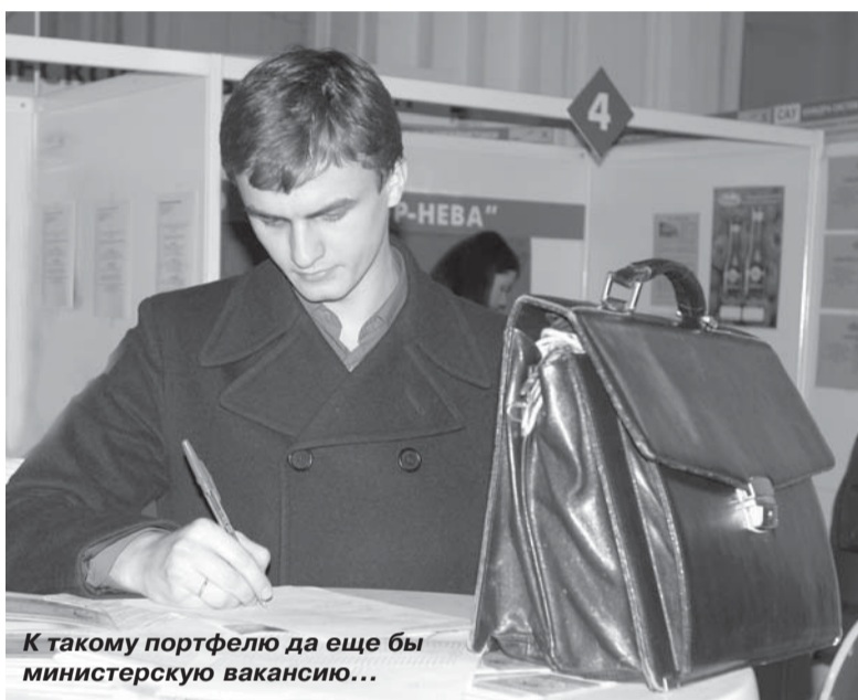
К такому портфелю да еще бы министерскую вакансию...

Дополнительная информация о вакансиях и предложениях – на сайте www.embit.ru . Информация для контактов: I учеб. корпус, Отдел практик и трудоустройства, к. 343, тел. (факс): 552-27-28; e-mail: mpkc@tu.neva.ru