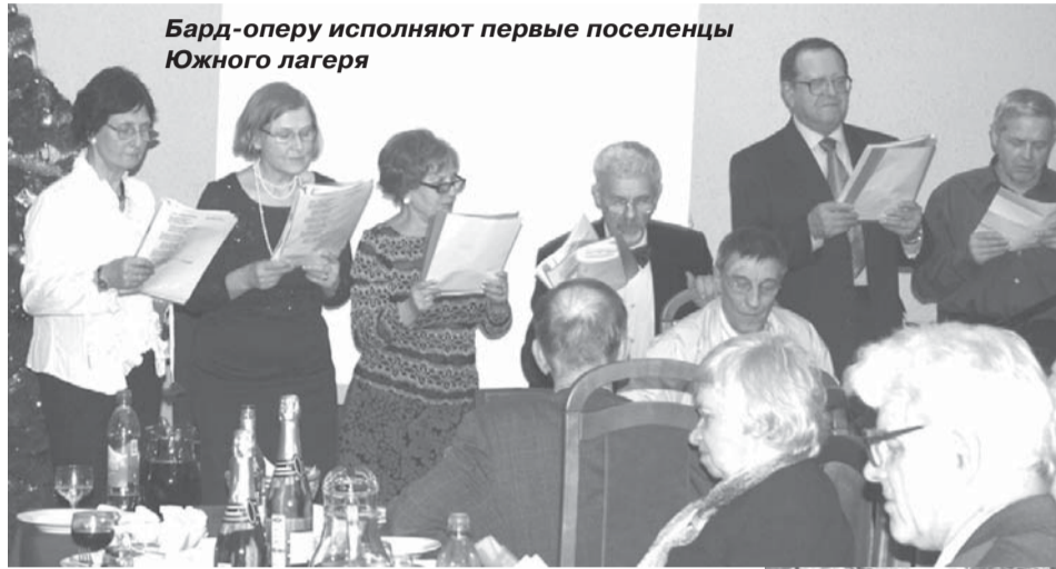
Бард-оперу исполняют первые поселенцы Южного лагеря