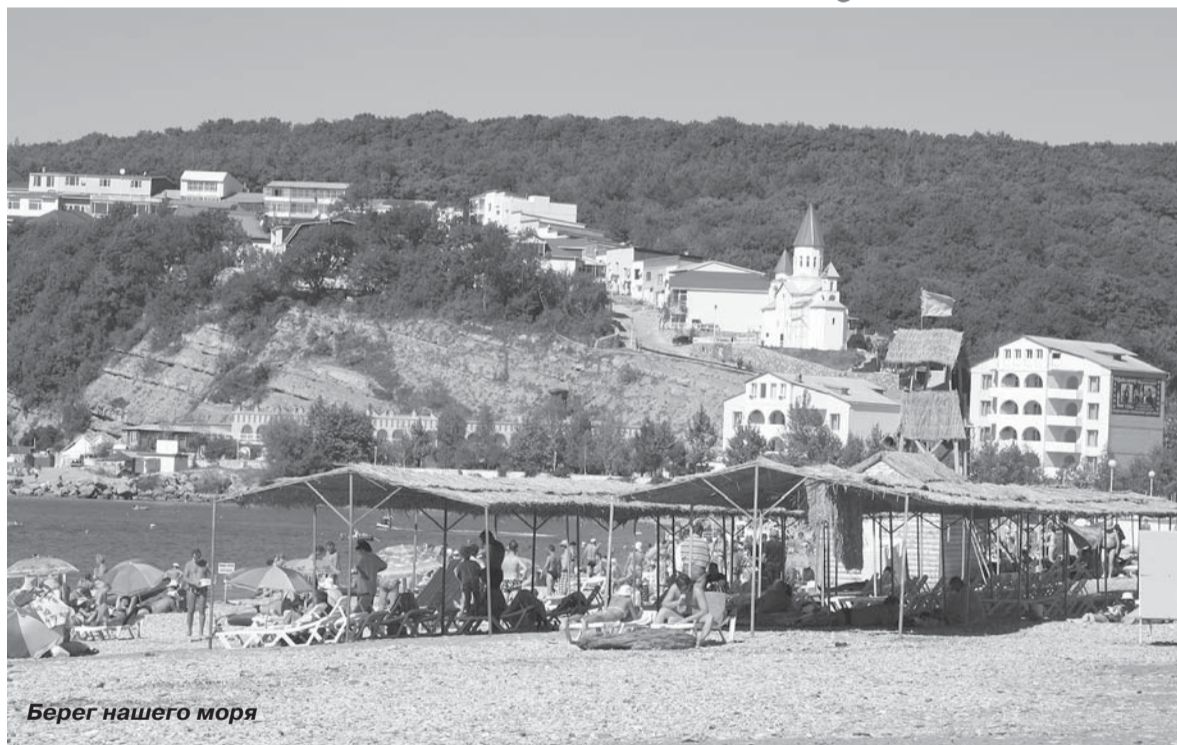
Берег нашего моря