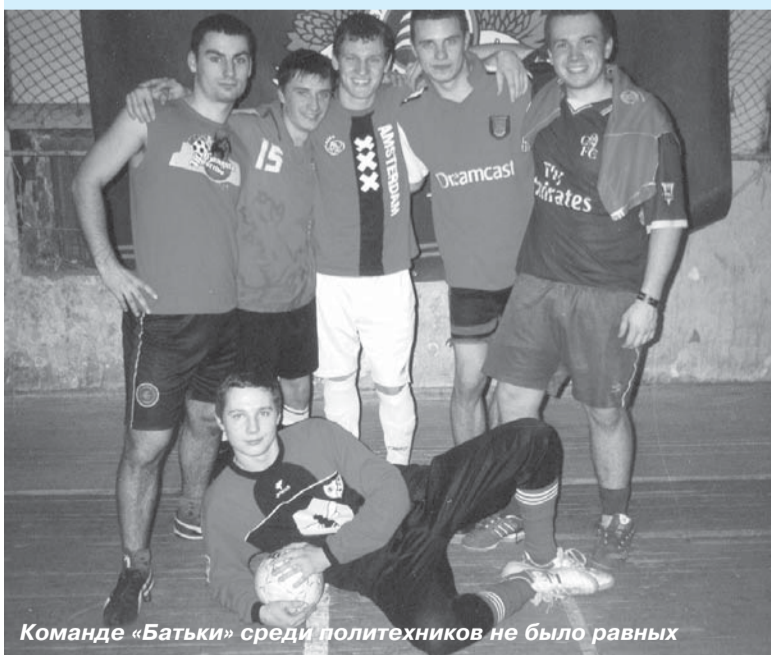
Команде «Батьки» среди политехников не было равных

В этом году прошел уже 14-ый традиционный турнир по мини-футболу, который пользуется огромной популярностью среди студентов, сотрудников и выпускников нашего университета. Игры проходят по субботам, что удобно всем.