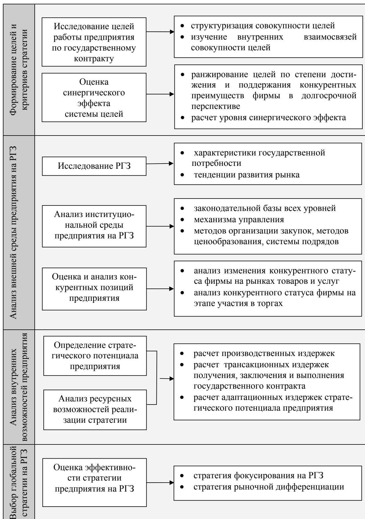
Рис. 2. Концептуальная схема формирования стратегии предприятия на рынке государственных заказов (РГЗ)