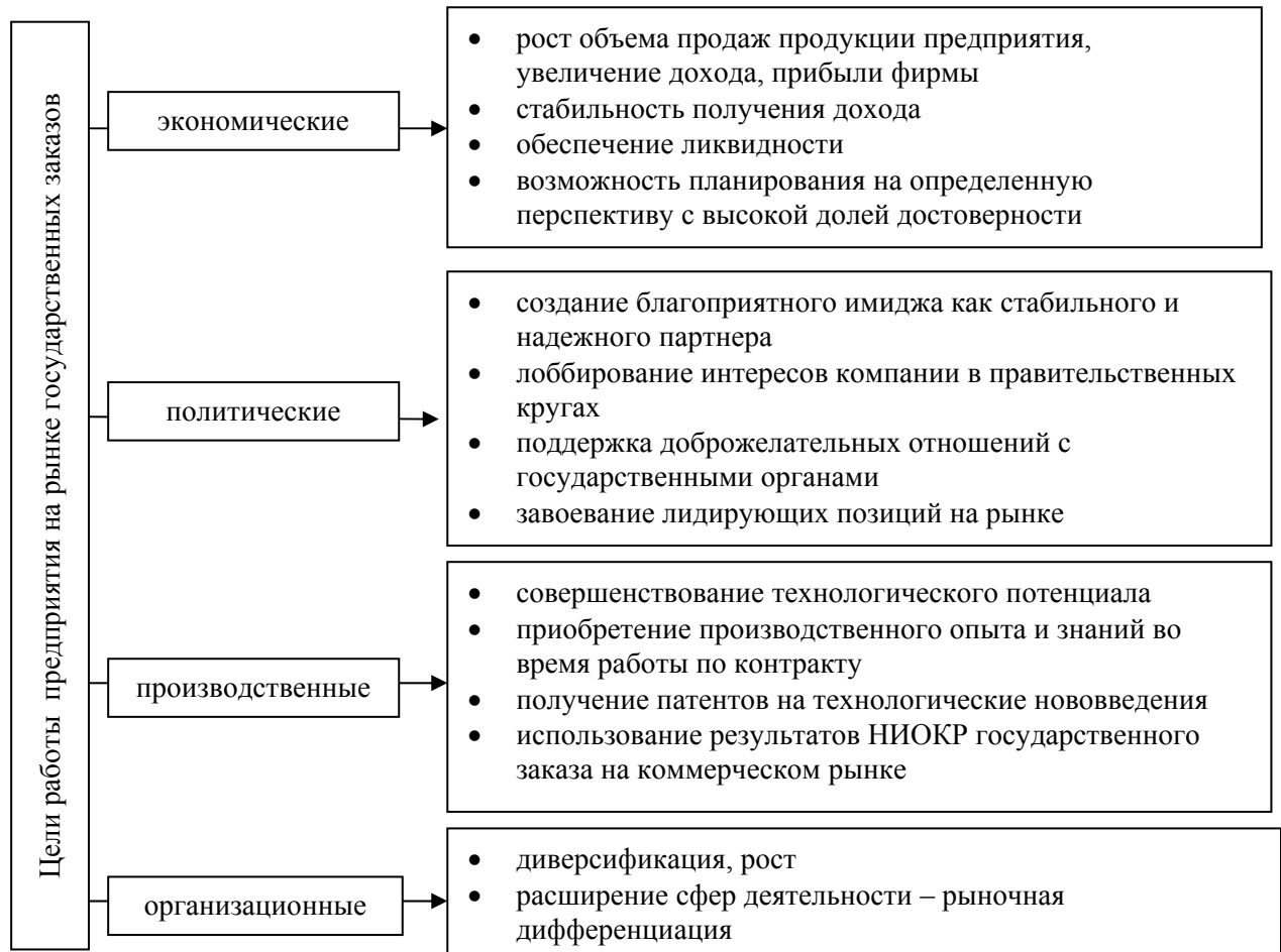
Рис. 3. Дерево целей работы предприятия на рынке государственных заказов

обеспечивая синергический эффект при отборе контрактов. Полученная на основании разработанного алгоритма оценка эффективности стратегии является обоснованием решения о фокусировании на рынке государственных заказов или рыночной дифференциации.