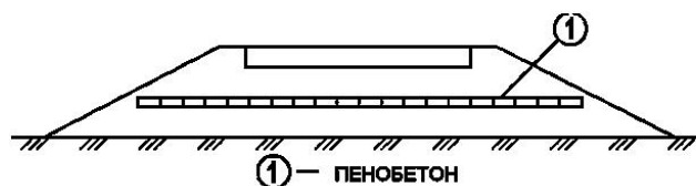
Рисунок 1. Схема дорожного полотна с использованием пенобетона

В качестве принципиальных вариантов конструктивных решений земляного полотна с теплоизоляционным слоем из пенобетона может предусматриваться конструкция, представленная на Рисунке 1. При этом теплоизолирующий слой может находиться как в основании насыпи, так и в её теле, либо в основании дорожной одежды.