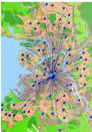
АСУ «Теплоучёт» в Санкт-Петербурге

С другой стороны, увеличение спроса на инструментальный учет тепла и горячей воды стимулирует появление на рынке большого числа приборов для этих целей. Например, за последние 5-6 лет в Госреестр СИ включено около 200 типов теплосчетчиков и тепловычислителей и свыше 75 типов счетчиков горячей воды. Более 220 типов теплосчетчиков, тепловычислителей и счетчиков горячей воды прошли экспертизу на соответствие требованиям Госэнергонадзора. Средства учета тепла и воды предлагают множество фирм. Среди них наиболее известны петербургские фирмы «Взлет», «Логика» и «Теплоком». А также представители московских компаний «ТБН», «Экос» и зарубежных – «Асвега» (Эстония), «Премекс» (Словакия), «Данфосс» (Дания) и др. Не профессионалу в этом море предложений весьма трудно разобраться и грамотно осуществить выбор конкретных типов средств учета и поставщиков.