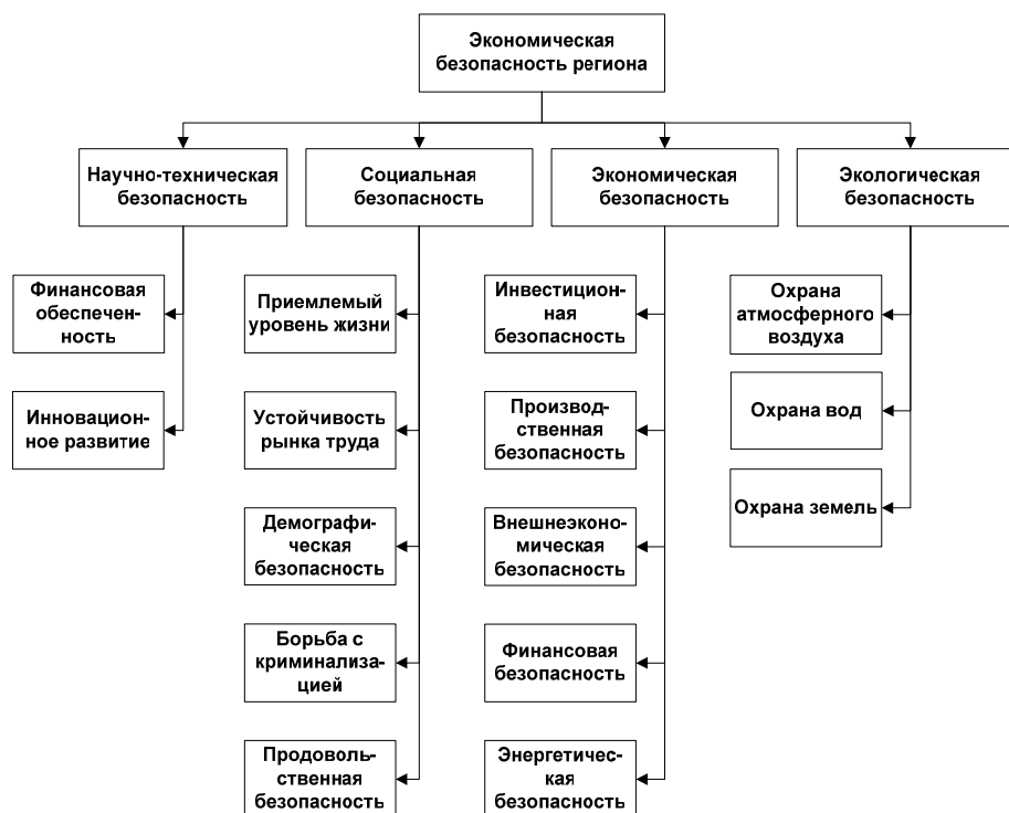
Рис. 1. Иерархия целей

В ходе проведения моделирования была построена концептуальная модель экономической безопасности региона в составе системы целей, критериев и показателей экономической безопасности региона, основанная на анализе выявленных особенностей факторов экономической безопасности и связей между ними. Иерархия целей для достижения экономической безопасности региона показана на рис. 1.