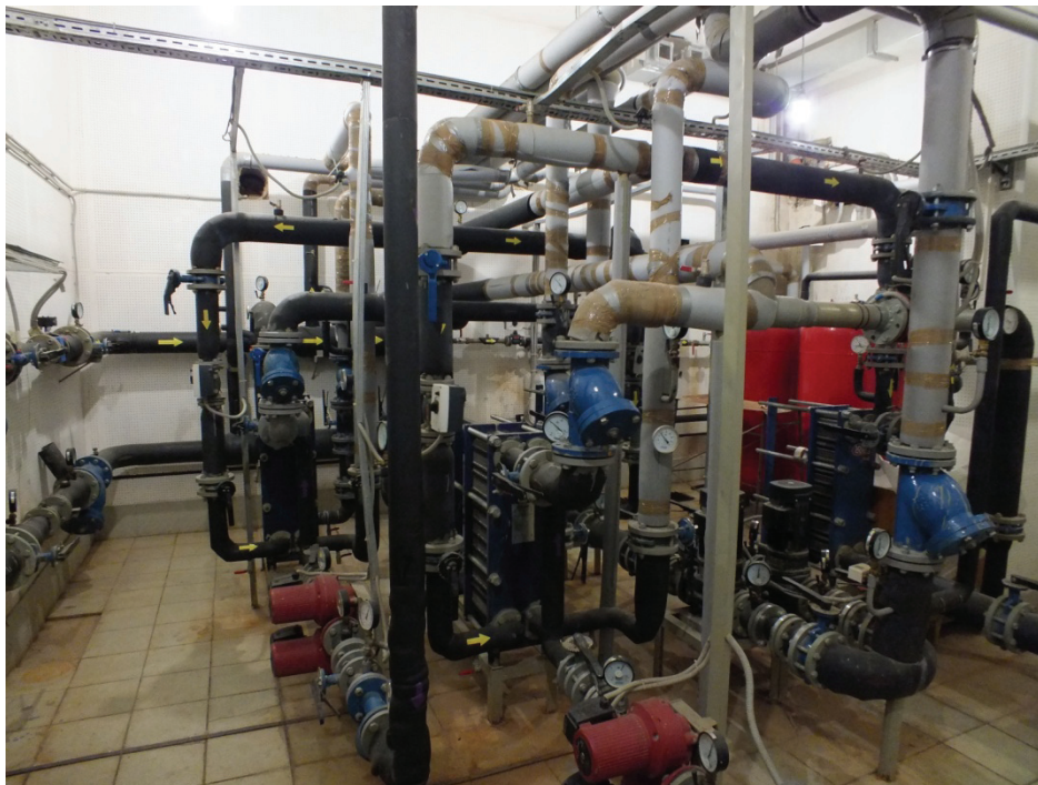
Рисунок 2. Общий вид теплового пункта обследованного здания

притворах. Требуемые по ГОСТ 30494–96 [22] параметры микроклимата в помещениях здания обеспечены. Вместе с тем, в ряде квартир зафиксировано неплотное примыкание притворов светопрозрачных ограждающих конструкций окон и балконных дверей, а также наружных дверей в лестнично-лифтовых узлах, что приводит к избыточным тепловым потерям вследствие инфильтрации воздуха через теплозащитную оболочку здания и снижению его энергоэффективности.