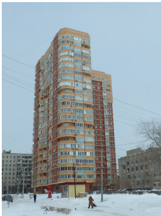
Рисунок 1. Общий вид обследованного здания

В ходе проведенного обследования установлено, что наружные ограждающие конструкции здания находятся в состоянии, обеспечивающем в целом нормальную эксплуатацию объекта в отопительный период. Окна, балконные и входные двери имеют уплотняющие прокладки в