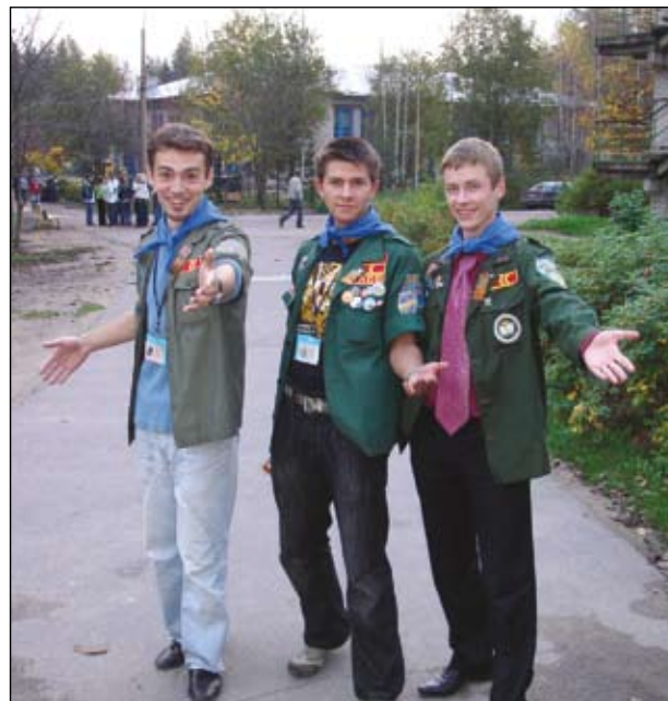
Центр студенческих перспектив – наш боевой отряд «быстрого реагирования». Есть интересные замыслы? – Приходите!