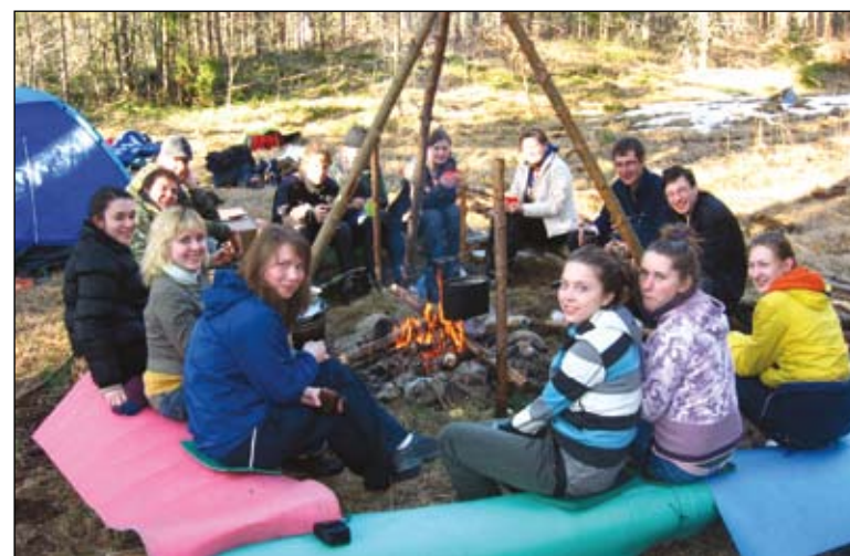
Песни у костра – главная составляющая отдыха. Исполнение «Тёмной ночи» стало теперь традицией карельских походов.

В 2006 г. началась долгая и пока еще не завершенная работа по систематизации архива музейных документов. Другое направление деятельности клуба – поездки и походы по местам боев. Это и традиционные университетские маршруты – Дорога жизни, Тайцы, и совершенно новые – Диорама «Прорыв», Лемболово, Невский пятачок. Особая гордость клубных энтузиастов – походы в Карелию, где в п. Сяндебя Олонецкого р-на в 1969 г. был установлен памятный знак воинам Выборгского полка 3-ей Фрунзенской дивизии народного ополчения, в котором сражались и политехники. В первом походе участвовало всего трое наших студентов, а в этом году их было уже 25 человек.