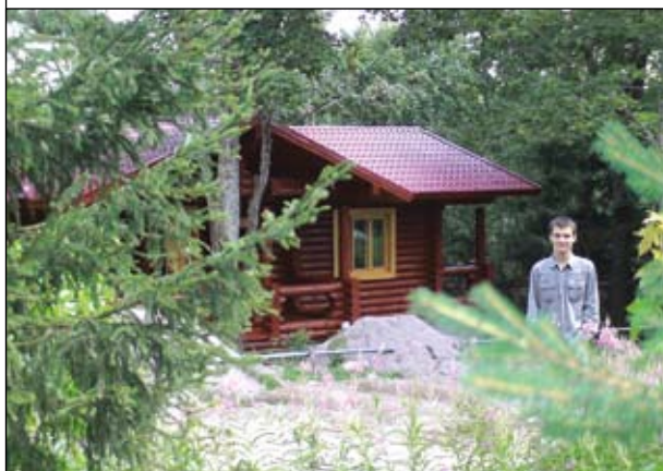
Северный лагерь расположен в пос. Горы Ленинградской области...