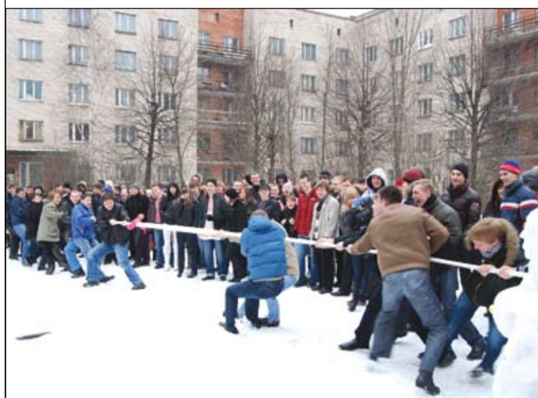
Масленичные гуляния по-политеховски