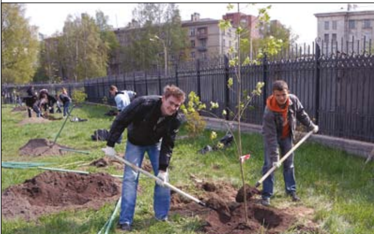
Посадишь дерево на «музыкальном субботнике» – оставишь себе долгую «зелёную» память