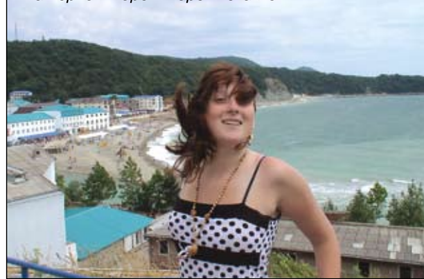
На Черном море – море впечатлений