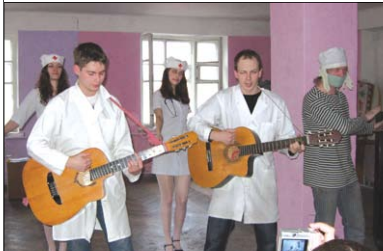
Традиция «капустников» в общежитии прописана постоянно