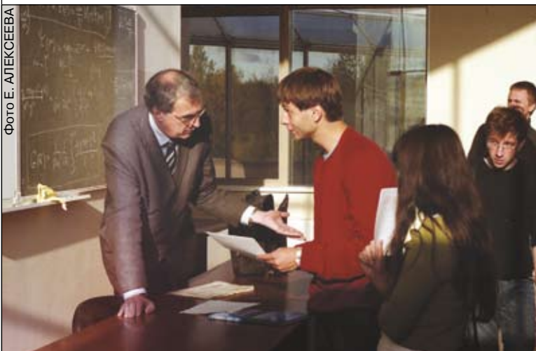
«Хочу всё знать!» – пылливый ум и любознательность ценятся преподавателями. Приобщиться к научному поиску можно уже с первого курса