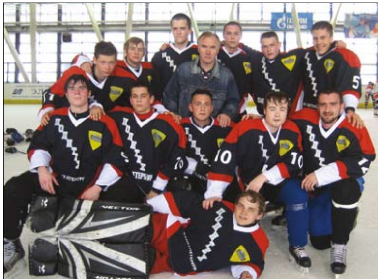
«Трус не играет в хоккей!». И это правда: наша бесстрашная команда стала бронзовым призёром чемпионата вузов СПб

Если ты любишь спорт, запомни! В Политехническом есть одна общая кафедра на все факультеты, где студенты имеют много возможностей заниматься физическим совершенствованием, поддерживать в здоровом теле здоровый дух.