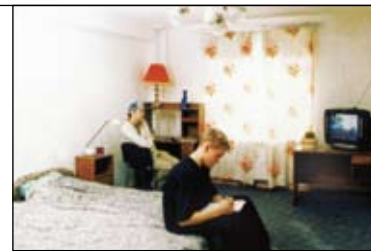
Комната в общежитии: начало XX в. и сто лет спустя