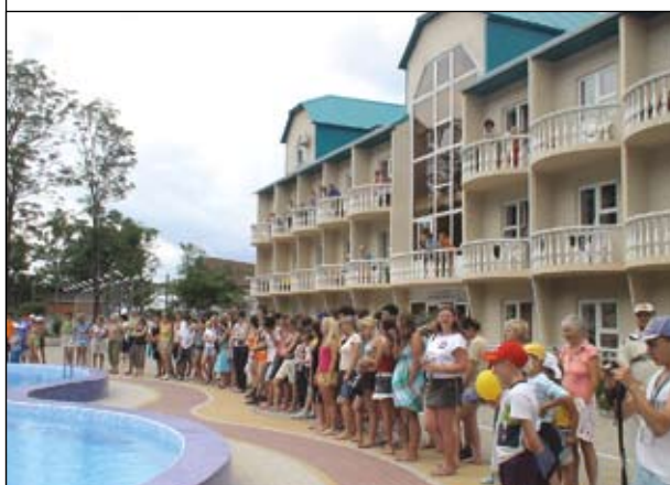
а Южный лагерь находится в пос. Новомихайловский Туапсинского р-на Краснодарского края