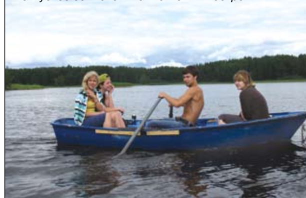
На Вуоксе есть свой «Таинственный остров»