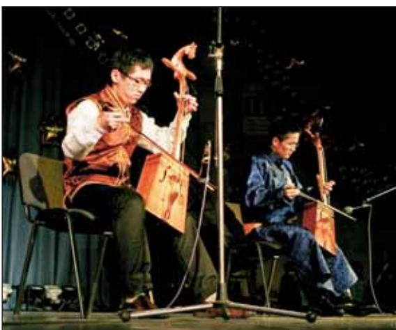
2 место в номинации «Музыкант»