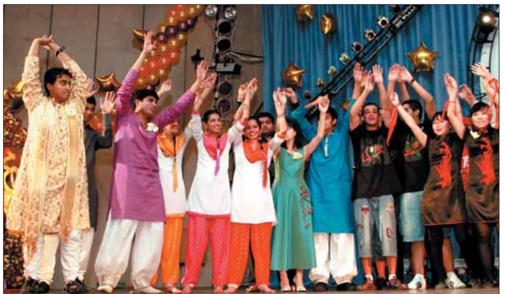
17 ноября в актовом зале ИМОП с большим успехом прошел гала-концерт Международного интернационального студенческого фестиваля «Золотая осень – 2009». Материал об этом читайте на 6-й стр.