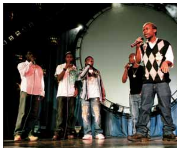
1 место в номинации «Вокал». Группа «Акапелла»

Вот и закончился наш фестиваль. На сцену поднялись все участники гала-концерта и замерли в ожидании оглашения решения жюри.