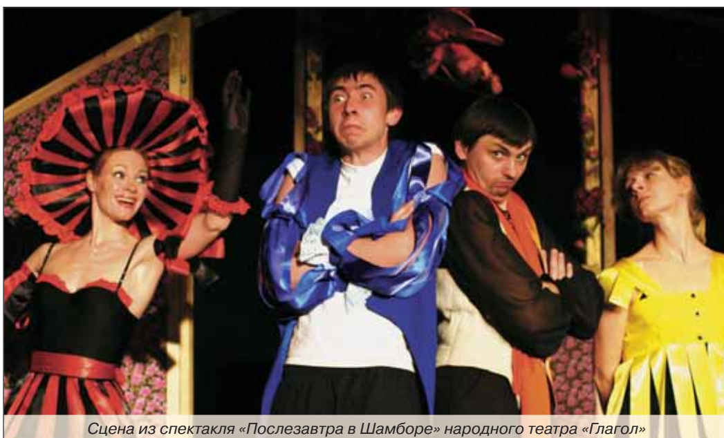
Сцена из спектакля «Послезавтра в Шамборе» народного театра «Глагол»

В разгаре 39-й сезон театра «Глагол», и вновь постоянные его зрители волнуются – успеют ли заказать билет. И это в театре, в котором билеты не продаются! А ответ в данном случае прост – настоящей театр купить нельзя. Как нельзя купить то, чем из года в год делятся со зрителем участники коллектива: доброту, ум, честность, интеллигентность, прямоту, доверие... и актерское мастерство. 31 октября давали (не сыграли – прожили!) «Послезавтра в Шамборе».