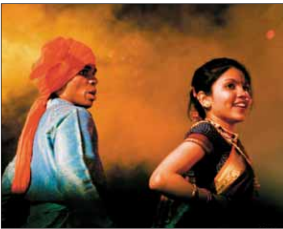
1 место в номинации «Танец». Группа «Ритм» (Индия)

17 ноября в актовом зале ИМОП с большим успехом прошел гала-концерт Международного интернационального студенческого фестиваля «Золотая осень – 2009».