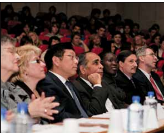
Почетные гости и члены жюри: перед трудным выбором

В этом году наш университет участвовал в конкурсе на проведение Межвузовского интернационального студенческого фестиваля и обошел своих соперников.