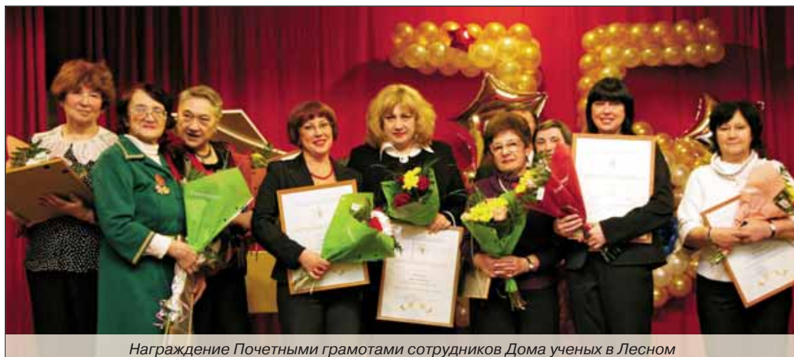
Награждение Почетными грамотами сотрудников Дома ученых в Лесном