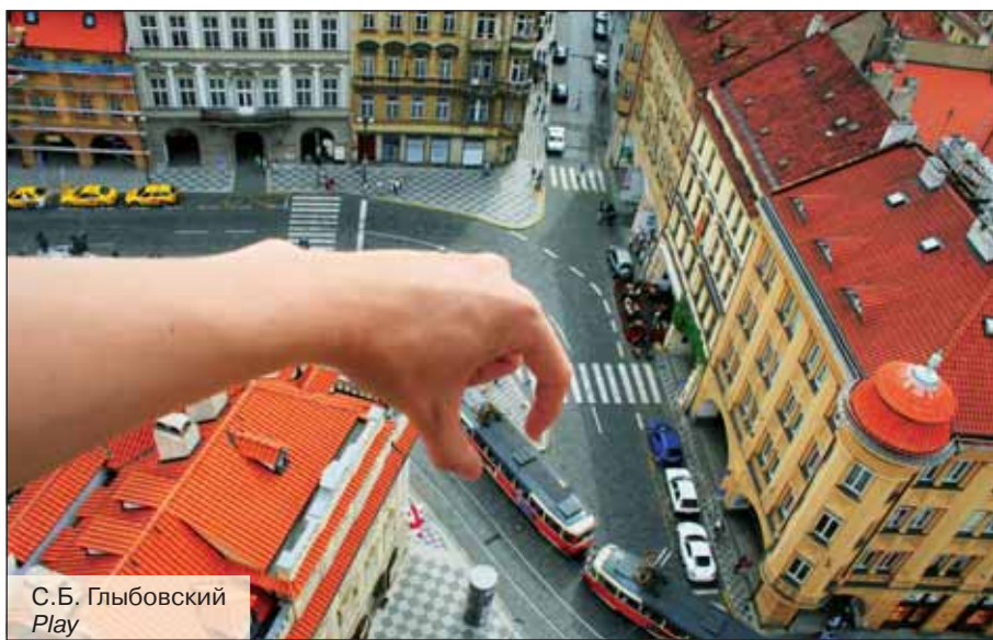
С.Б. Глыбовский Play

27 ноября в Выставочном зале Главного здания состоялось закрытие осенней экспозиции «Политех-Фото». Более 200 работ от 93 авторов-политехников в течение 2 недель радовали взгляды многочисленных посетителей.