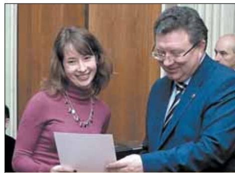
Церемония награждения – процедура обоюдоприятная

Политех сам является организатором многих студенческих состязаний. Среди них международные и всероссийские олимпиады по автоматическому управлению (совместно с СПбГУ ИТМО); «Компьютерное моделирование наноструктур и возобновляемых источников энергии»; региональные олимпиады: по робототехнике; ряд олимпиад с использованием интернет-технологий; международные инженерные студенческие соревнования (2009 – 2010 гг.).