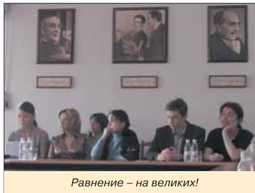
Равнение – на великих!