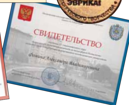
КОНКУРС СПбГПУ «СТУДЕНТ ГОДА ПО ДОСТИЖЕНИЯМ В НАУЧНО-ИССЛЕДОВАТЕЛЬСКОЙ РАБОТЕ»