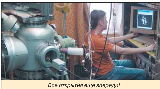
Все открытия еще впереди!