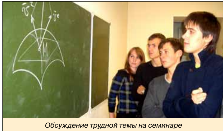
Обсуждение трудной темы на семинаре