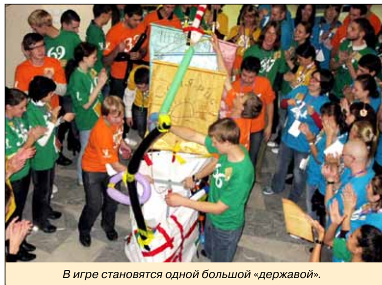
В игре становятся одной большой «державой».

Второй этап – командные игры. Я знал, что здесь нужно активно и конструктивно участвовать в обсуждениях. Однако на деле сделать это довольно трудно: все кричат и никто не слушает ни себя, ни соседа. К концу все очень устало, а половина заданий оказалась проигранной из-за неслаженной командной работы. Мне особенно приятно, что судьи посчитали, что я все же внес в работу положительный вклад. Это был мой первый опыт, но я мечтаю попробовать свои силы и в следующем году. Если у вас появится такая возможность, обязательно испытайте себя. Удачи!