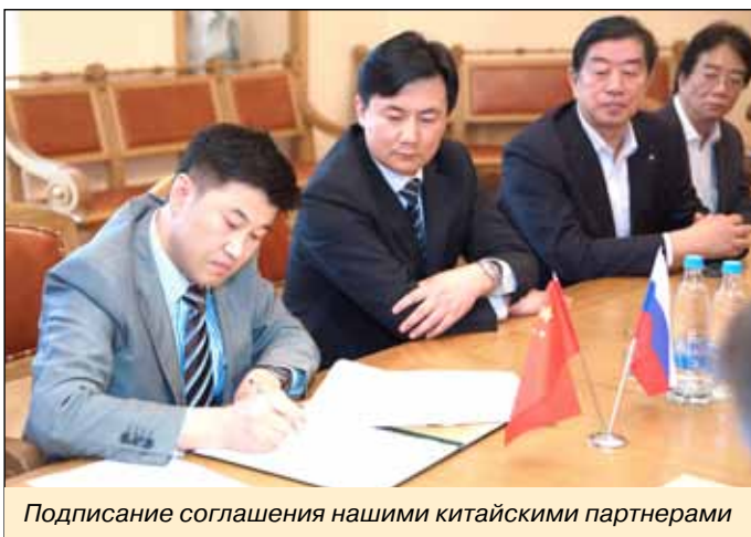
Подписание соглашения нашими китайскими партнерами