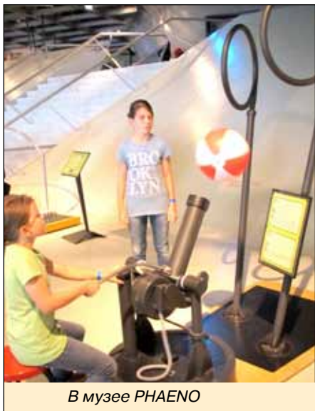
В музее PHAENO

Такие музеи давно существуют во многих городах Европы, США, других стран. Уже сформировалась целая индустрия научных развлечений, позволяющая повысить интерес детей и молодежи к науке об окружающем мире. У нас она только начинает проникать в образовательное пространство страны. Хочется, чтобы таких музеев, как PHAENO и «Лабиринтум», было больше.