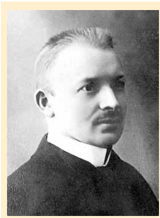
Леонид Владимирович Ассур

Сто лет тому назад, в 1914 г., в «Известиях» Политехнического института вышла первая из двух книг диссертации «Исследование плоских стержневых механизмов с низшими парами с точки зрения их структуры и классификации». Автор – ученый-политехник Леонид Владимирович Ассур. Через год он опубликовал вторую книгу своего труда, а в 1916 г. на заседании Ученого совета состоялась защита диссертации Ассура. Официальными оппонентами были крупные ученые профессора Н.Е. Жуковский (Московский университет), Д.Н. Зейлингер (Казанский университет) и А.А. Радциг, бывший в то время деканом