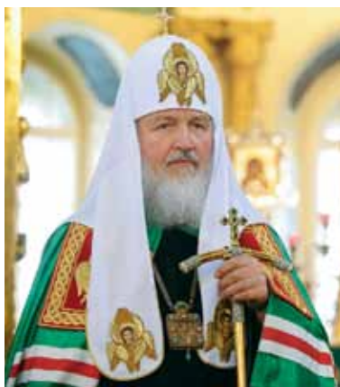
Патриарх Московский и всея Руси Кирилл

Его книги широко используются при изучении курса по истории религии и Церкви, который читается в ряде российских вузов. В апреле 1993 г. владыка освятил Покровский храм нашего университета, после чего там возобновились регулярные богослужения.