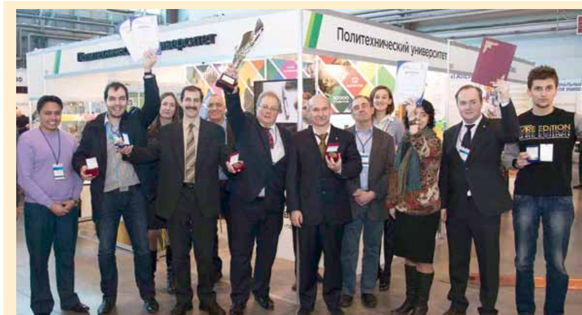
Проекты ученых СПбГПУ завоевали Гран-при, 4 золотые и 2 серебряные медали

В рамках проекта впервые в мировой научно-технической практике разработана и эффективно применяется принци-