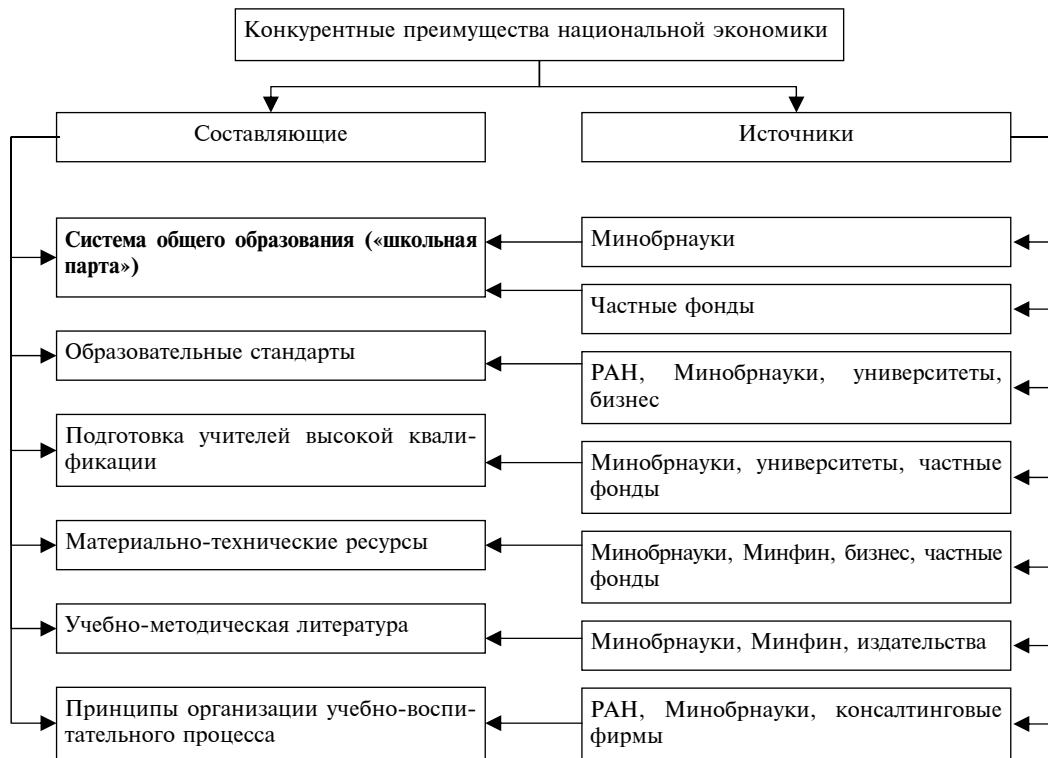
Рис. 2. Субстратегическая классификация составляющих и источников конкурентных преимуществ, обусловленных системой общего образования

Полностью продемонстрировать тактическую и субтактическую классификации всех составляющих и источников конкурентных преимуществ национальной экономики не представляется возможным. Остановимся лишь на главных, на наш взгляд, составляющих и источниках.