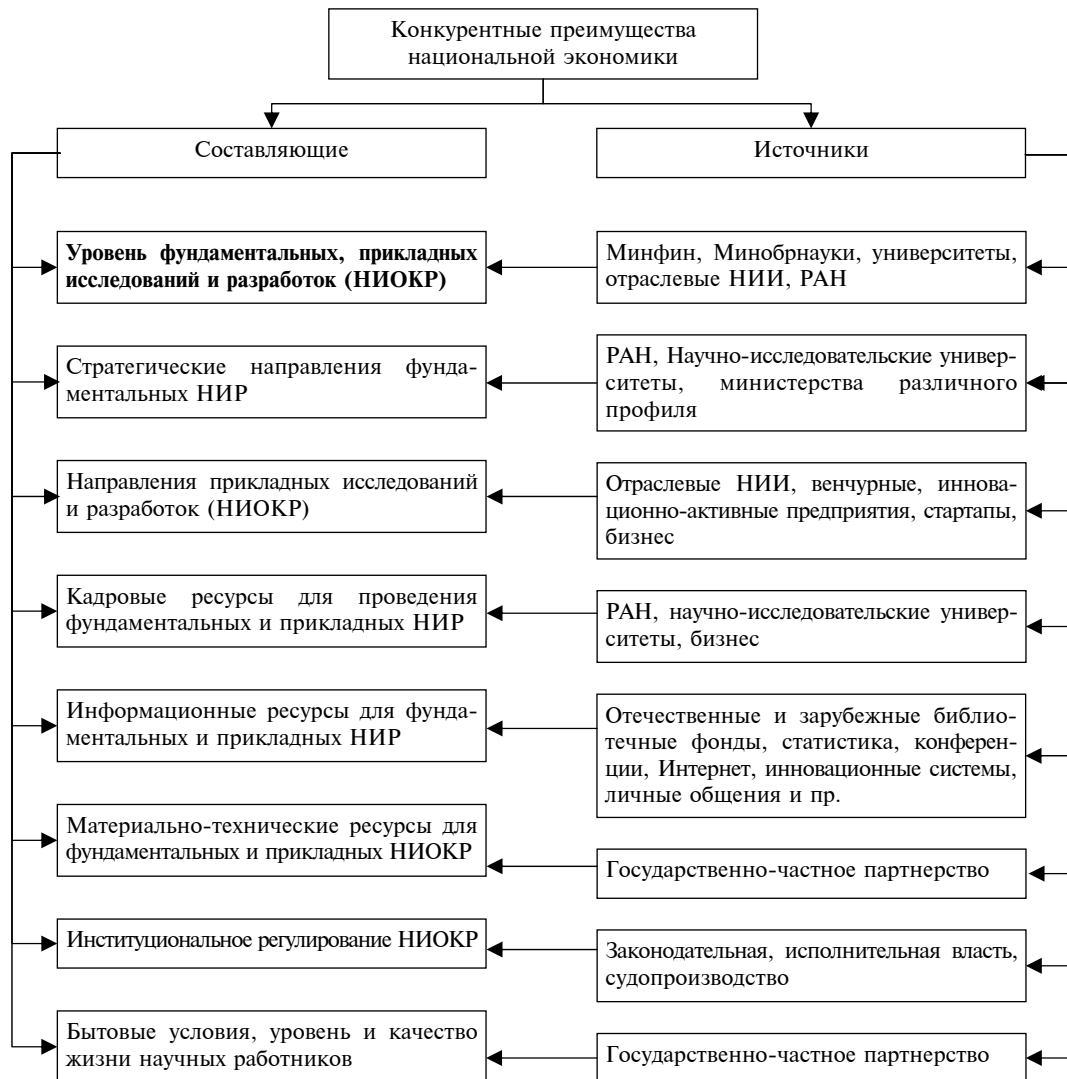
Рис. 4. Субстратегическая классификация составляющих и источников конкурентных преимуществ, обусловленная уровнем фундаментальных, прикладных исследований и разработок

В Федеральном государственном образовательном стандарте высшего профессионального образования по направлению подготовки 080100 «Экономика» степени магистра [9] подробно изложены требования к его компетенции, однако в стандарте отсутствует главная, на наш взгляд, цель – необходимость достижения высокого уровня креативности будущего магистра.