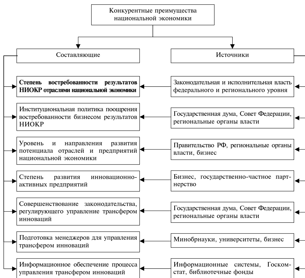
Рис. 5. Субстратегическая классификация составляющих и источников конкурентных преимуществ, обусловленных востребованностью инноваций

уровнем фундаментальных, прикладных исследований и разработок. Как видим, структура составляющих и источников конкурентных преимуществ, обусловленных уровнем фундаментальных, прикладных исследований и разработок, весьма сложна и разнообразна. Главным элементом этой структуры является человеческий капитал. Все остальные составляющие – это, по существу, инфраструктура, обслуживающая научные учреждения и их работников. От качества этой инфраструктуры во многом зависит эффективность функционирования человеческого капитала.