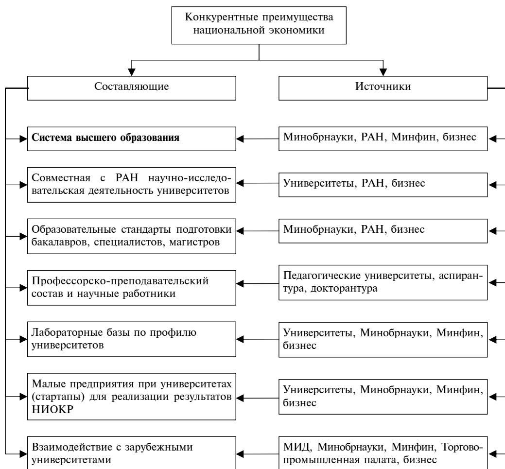
Рис. 3. Субстратегическая классификация составляющих и источников конкурентных преимуществ, обусловленных системой высшего образования

Соответственно должны быть конкретизированы и источники достижения цели повышения уровня креативности учащихся. Подобная конкретизация должна осуществляться на основе соответствующей институциональной и финансовой политики государства. Это относится ко всем министерствам, ведомствам, частным фондам и спонсорам, участвующим в инвестировании «школьной парты». Именно эта «парта» обеспечила в свое время высокий уровень научных достижений СССР.