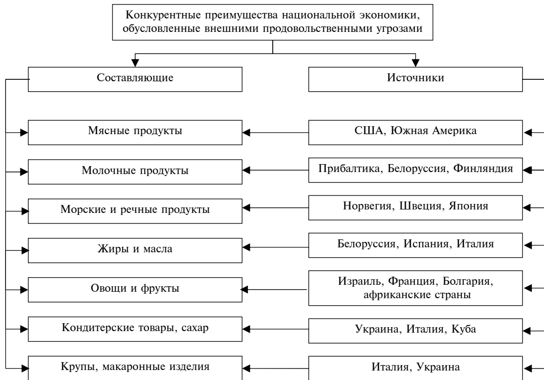
Рис. 7. Тактическая классификация составляющих и источников конкурентных преимуществ, обусловленных внешними продовольственными угрозами