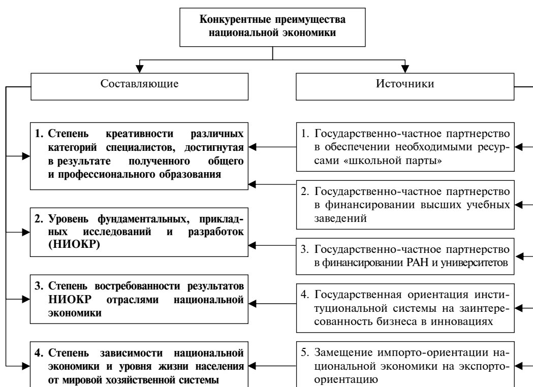
Рис. 1. Стратегическая классификация источников и составляющих конкурентных преимуществ национальной экономики

Вспомним определение стратегии, данное фельдмаршалом Мольтке: «Стратегия всегда может направлять свои стремления лишь на самую высокую цель, которую вообще только можно достигнуть при имеющихся средствах» [13]. Такой целью стратегического управления современным бизнесом становится разрешение возникающих проблемных ситуаций.