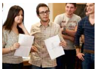
«Семья» – забудь про своё «я», теперь – только «мы»