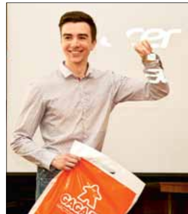
Участник форума вытаскил «выигрышный номер» и стал счастливым обладателем приза от GaGaGames!

Подобные карьерные форумы становятся все более популярны-