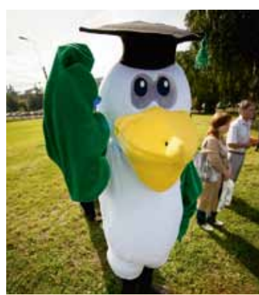
Пеликан – символ профсоюза студентов, символ заботы

Тот, кто привык быть в курсе всех событий или хочет сам научиться «выдавать» свежие новости, пусть смело направляется в редакцию нашего красочного