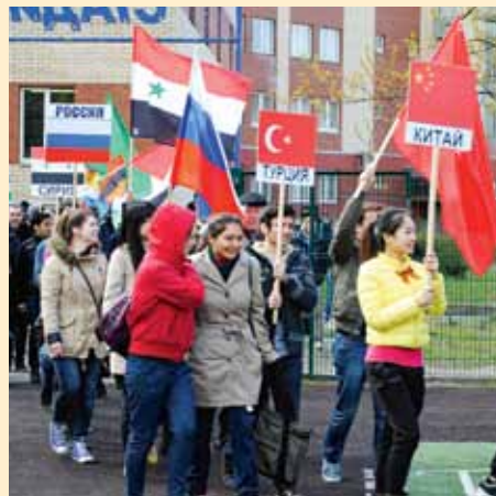
У нас проводятся даже свои Олимпийские игры, но и во Всемирных мы тоже принимали участие — там работали наши волонтеры