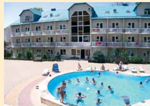
Наш Южный лагерь у самого синего моря