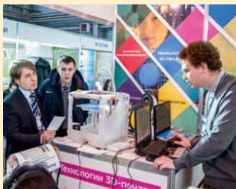
Презентация проекта «DIY 3D-принтер»