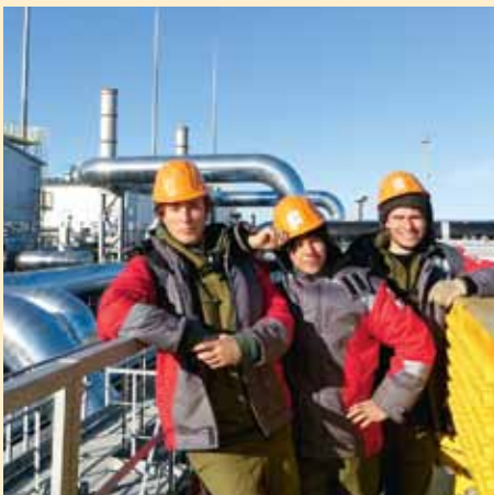
Стройотрядовское лето — в памяти многих поколений политехников