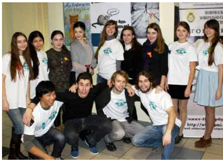
Покровский форум: хорошо быть вместе