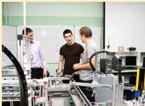
В лаборатории университета