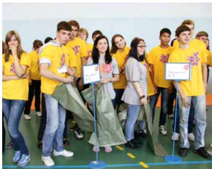
Веселые старты на выезде между общежитиями