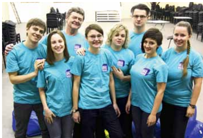
Команда Студклуба, сайт – www.sc.spbstu.ru

Студенческий клуб СПбПУ – это современное молодежное пространство с зоной свободного общения «PRIME:TIME». Здесь можно отдохнуть в теплой (подогреваемой чашем) дружеской атмосфере, чему-то научиться, чему-то научить других, получить свободный доступ в интернет или просто поболтать ( vk.com/primetime_sc ).