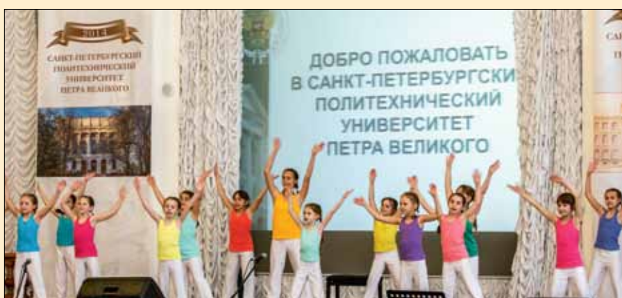
Будущее поколение политехников приветствует политехников нынешних