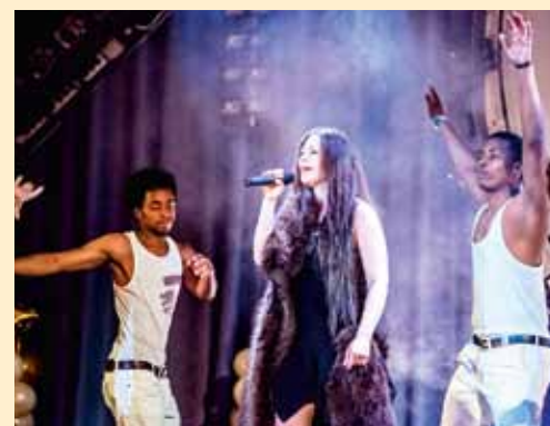
Ежегодно восходит новая «Звезда Политеха»