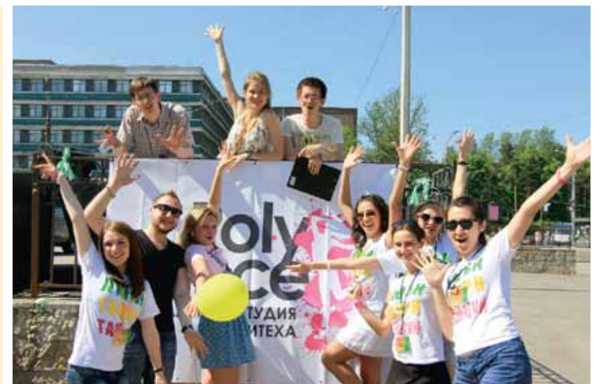
Танцуем все, танцуем всё!