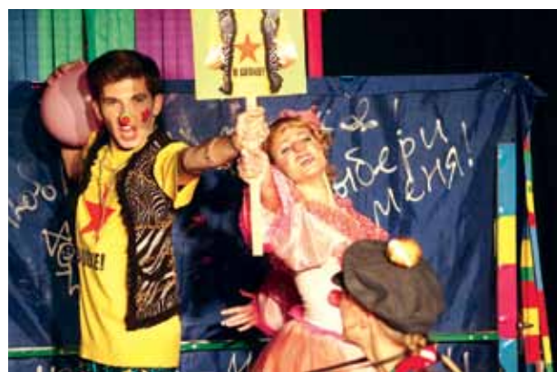
Фрагменты из спектаклей: «12,5 дураков» (театр «Глагол») и «Трехгрошевая опера» (театр ВТУЗа)