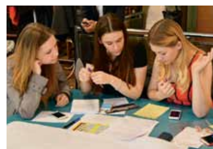
Решение кейса от компании «P&G» в самом разгаре