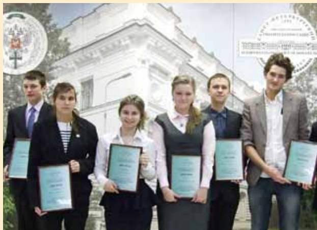
Дерзость научных проектов — залог успешного будущего!