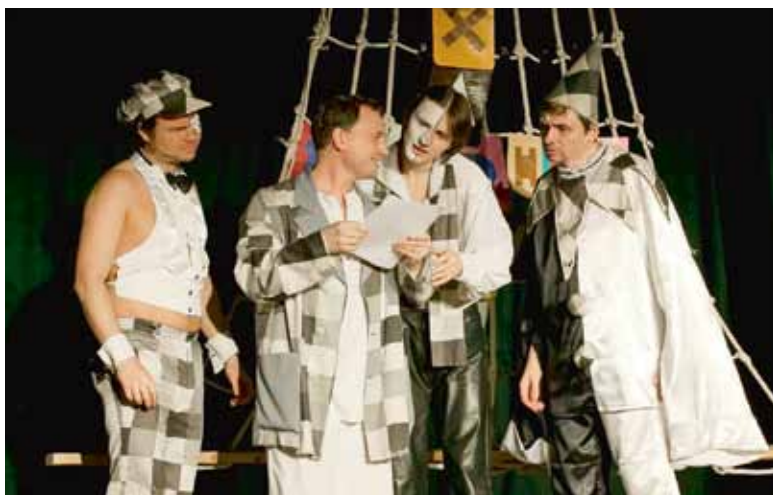
Вот он, многоЛИкий Хармс