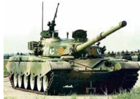
Основной танк Т-80 – первый и в нашей стране, и за рубежом танк с газотурбинным двигателем – состоит на вооружении в России и других странах и до сих пор считается одним из лучших в мире. Руководитель работ – зав. кафедрой 1946-49 гг. Ж.Я. Котин.

При вузе создан Автоцентр, поддерживающий связи с автопредприятиями и правительством нашего города.