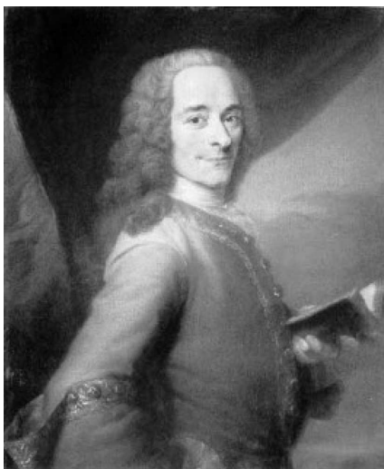
Портрет Вольтера (худ. Морис-Кантен де ля Тур)

впечатление, что, возвратившись во Францию, он завершает работу над книгой, в которой с достаточной определенностью формулирует свои философско-деистические и политические взгляды, связанные с идеями просветительства, религиозной терпимости и парламентаризма в рамках монархии. В 1733 году его книга под названием «Письма об английской жизни» была опубликована в Англии, а годом позже она вышла во Франции как «Философские письма», но вскоре была осуждена Парижской судебной палатой на сожжение. И это понятно: для своего времени «Письма» были одной из первых бомб, брошенных в феодальное общество. Для современной исторической и даже философской (несмотря на существование в ней различных направлений) науки Вольтер, идеализируя английскую конституцию и — отчасти — квакеров, четко призывал к веротерпимости, что для королевской Франции было ересью.