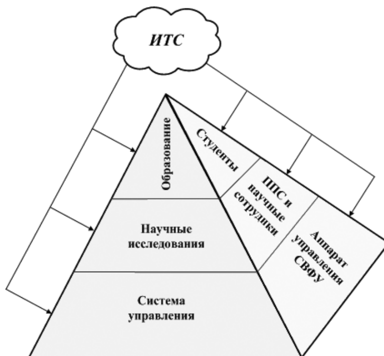
Рис. 2. Роль ИТС в пирамидальной модели

Элемент «Выполнение» связан с реализацией всех мероприятий, которые были запланированы. Обычно при реализации большой и сложной системы вводятся некоторые изменения. Для того чтобы оце-