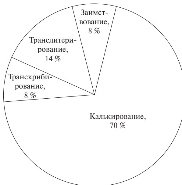
Использование приемов перевода профессиональной лексики

Первичные данные анализа использования способов перевода профессиональной лексики представлены на рисунке.