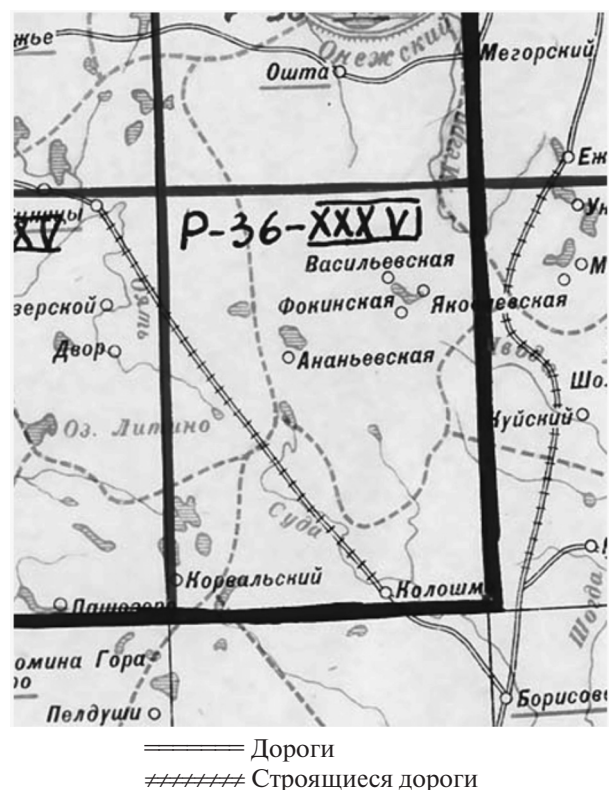
Рис. 2. Нереализованный проект строительства связующих участков дорожной инфраструктуры между районами Ленинградской области (Фрагмент административной карты 1931 г., выпущенной сектором народнохозяйственного учета Леноблплана)

Особенности строительства местной дорожной инфраструктуры в СССР сводились к