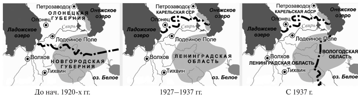
Рис. 1. Изменение административно-территориального деления в зоне проживания вепсов: Российская империя – СССР (1900-е – 1937 г.)

С 1938 г. по отношению к вепсам стала проводиться тайная политика, направленная на ускорение их ассимиляции. Советское государство постепенно меняло курс на «слияние» всех наций в «социалистическую» и создание «новой исторической общности – советского народа». Согласно этой идеологии, дальнейшее самобытное существование миноритарных этносов представлялось бесперспективным [14].