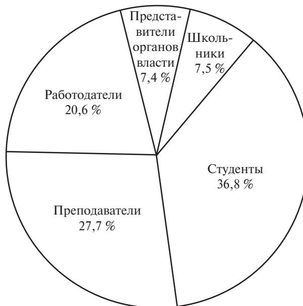
Рис. 1. Структура социальной принадлежности респондентов

* Данные приведены без учета дисциплин, реализуемых в рамках магистерской программы «Экология и природопользование».