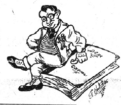
Плоды работы профкома