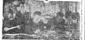
Оборудован IV класса, кончающе ГЭС.

УМЕЛА ОРГАНИЗАЦИЯ И ПРАВИЛЬНОЕ ПРОВЕДЕНИЕ АКТИВНОГО МЕТОДА — ЛУЧШИЙ СПОСОБ ПОВЫШЕНИЯ КАЧЕСТВА ПОДГОТОВКИ СПЕЦИАЛИСТОВ