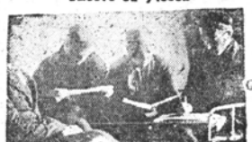
Ученики II к. ГЭС

УМЕЛА ОРГАНИЗАЦИЯ И ПРАВИЛЬНОЕ ПРОВЕДЕНИЕ АКТИВНОГО МЕТОДА — ЛУЧШИЙ СПОСОБ ПОВЫШЕНИЯ КАЧЕСТВА ПОДГОТОВКИ СПЕЦИАЛИСТОВ