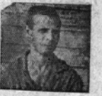
наб. „Л. Правды“, 16 л. производителю

Только применяя методы соревнования, ударничества, оказывая товарищескую помощь отстающим, сумели ударники производить вы-полнить задание партии