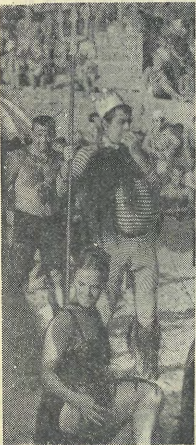
Южный спортивный лагерь. Праздник Нептуна.

М-30189 Заказ № 1386 Типография им. Володарского Ленинзлата, Ленинград, Фонтанка, 57.