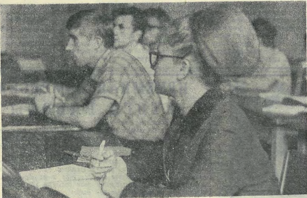
Снимок № 3