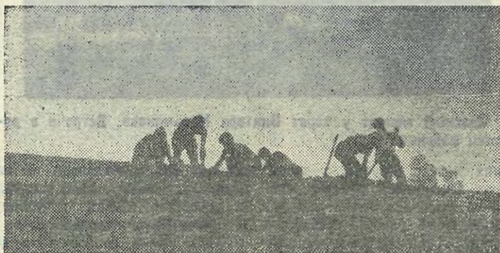
Силуэты третьего трудового семестра — Ленинградская область.

Работа, как нас и предупреждали, была не из легких, но, как показал итог, мы с ней успешно справились. Без лишней скромности можно отметить, что наш отряд вышел на 1-е место в соревновании. Дружеская помощь командира, веселая шутка комиссара — все это помогало в работе. А после работы — отдых, прогулки по Будапешту, поездки