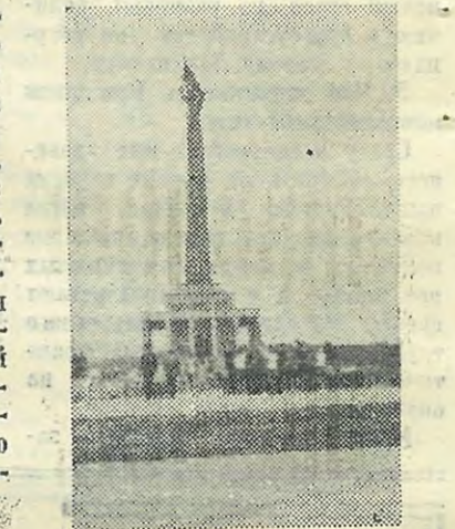
«Славия». Памятник советским воинам, погибшим во время 1941—1945 гг. за освобождение Братиславы.