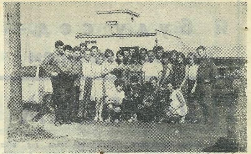
Фото на память. В середине — директор фабрики.

ЕЖЕГОДНО по договоренности ЦК ВЛКСМ и ЦК ЧСМ вузы СССР и Чехословакии обмениваются студенческими строительными отрядами. Нашим партнером в этом году была Высшая школа текстиля и машиностроения в г. Либерце. 20 человек — ребята с разных факультетов нашего института — составили отряд. Это студенты, умеющие одинаково хорошо и вести спор на политические и экономические темы, и играть в футбол и волейбол, и трудиться, и высту-