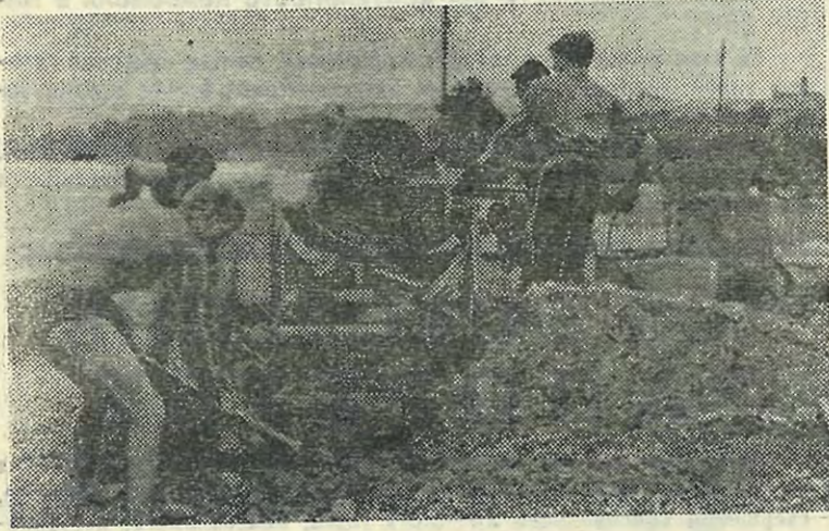
Наши ребята готовят раствор для бетонирования.

М-13947 Заказ № 1539 Типография им. Володарского Лениздата, Ленинград, Фонтанка, 57.