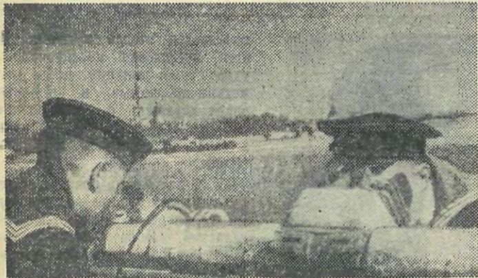
Моряки Балтики на защите Ленинграда.

Девятистодневной блокадой, голодом, постоян-