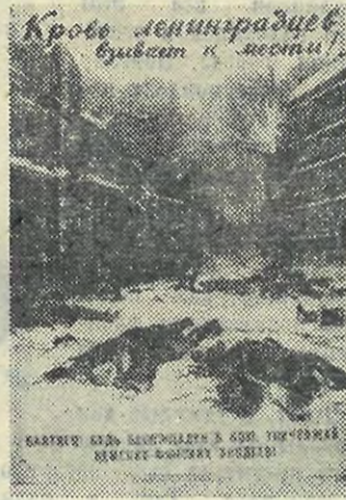
Плакат «Кровь ленинградцев зовет к мести».