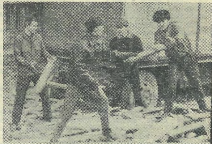
● 3500 студентов нашего института трудились на Всесоюзном субботнике 12 апреля с. г. На снимке: работают физики на пр. Науки.