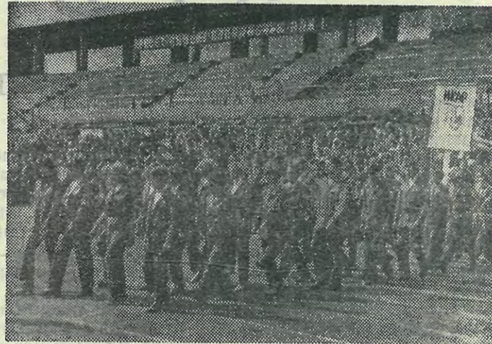
Идут строительные отряды.