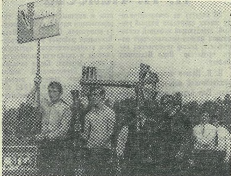
Символический ключ знаний у студентов ЭМФ.

Итак, торжественный августовский праздник закончился. Это было светлое начало трудного пути студентов — первокурсников, избравших специальность инженера.