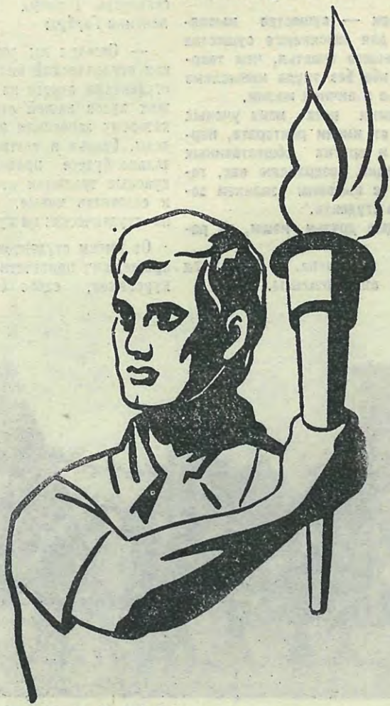
Рис. М. Полярного

Репортаж о посвящении читайте на 2-й и 3-й страницах.