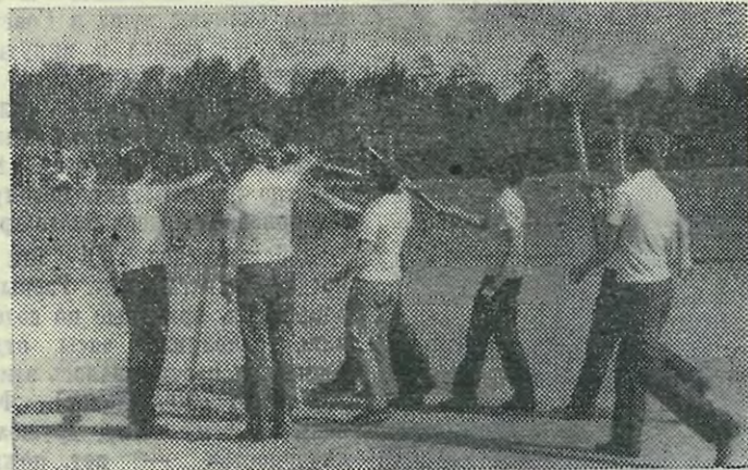
Факельщики у чаши знаний.