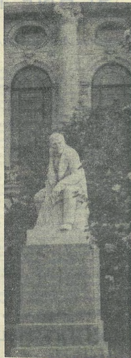
Памятник В. И. Ленину у главного здания нашего института.

Политехнический институт имел революционные традиции. Ведь еще в 1902 году в только что появившемся на свет учебном заведении была создана студенческая социал-демократическая группа. В годы нового революционного подъема и первой мировой войны большевики имели в Политехническом институте