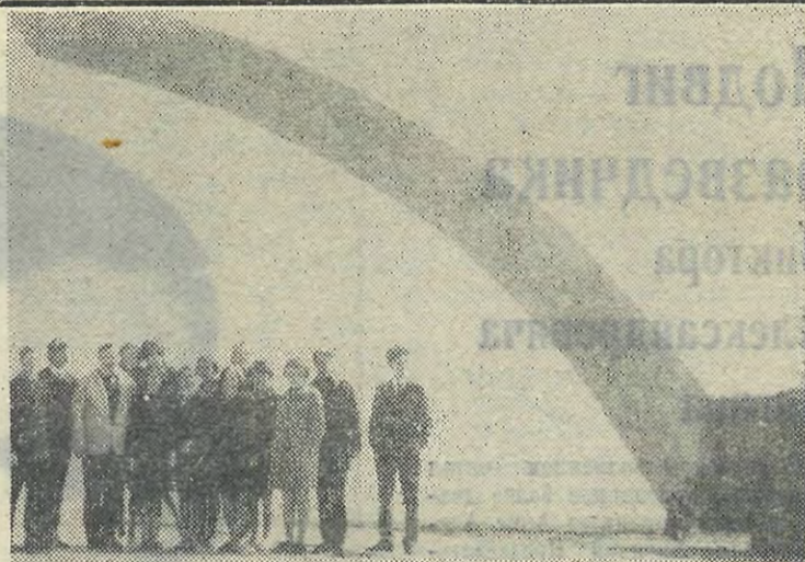
НА СНИМКЕ: группа студентов ФМФ на экскурсии «Дорога жизни».