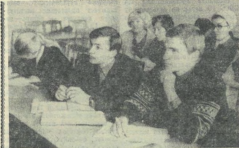
НА СНИМКЕ: лучшая группа 311/3.