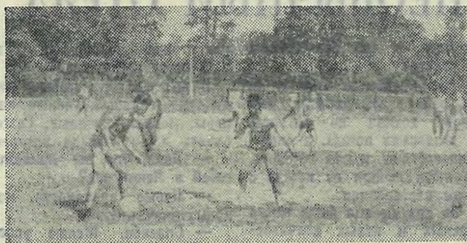
Чемпионат в интернациональном лагере по футболу. Играют вьетнамские и африканские студенты.