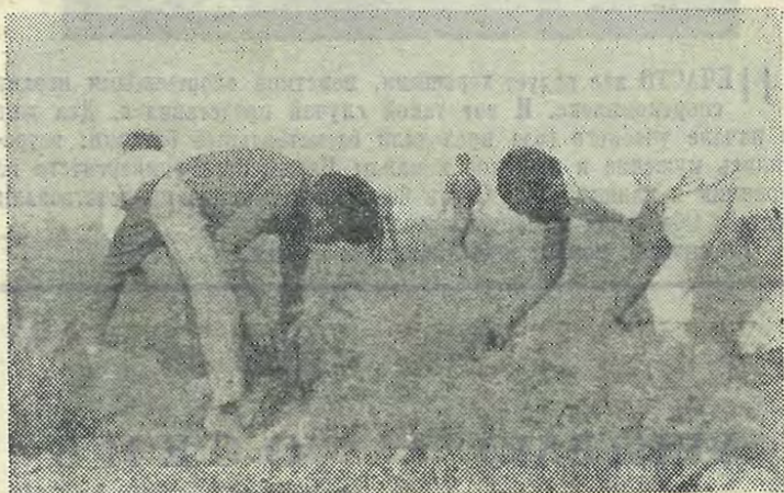
Студенты-африканцы на уборке моркови в совхозе «Петродворцовый».

ОБЕЙД ХАНИ, студент гр. 323/1а, (Иордания)