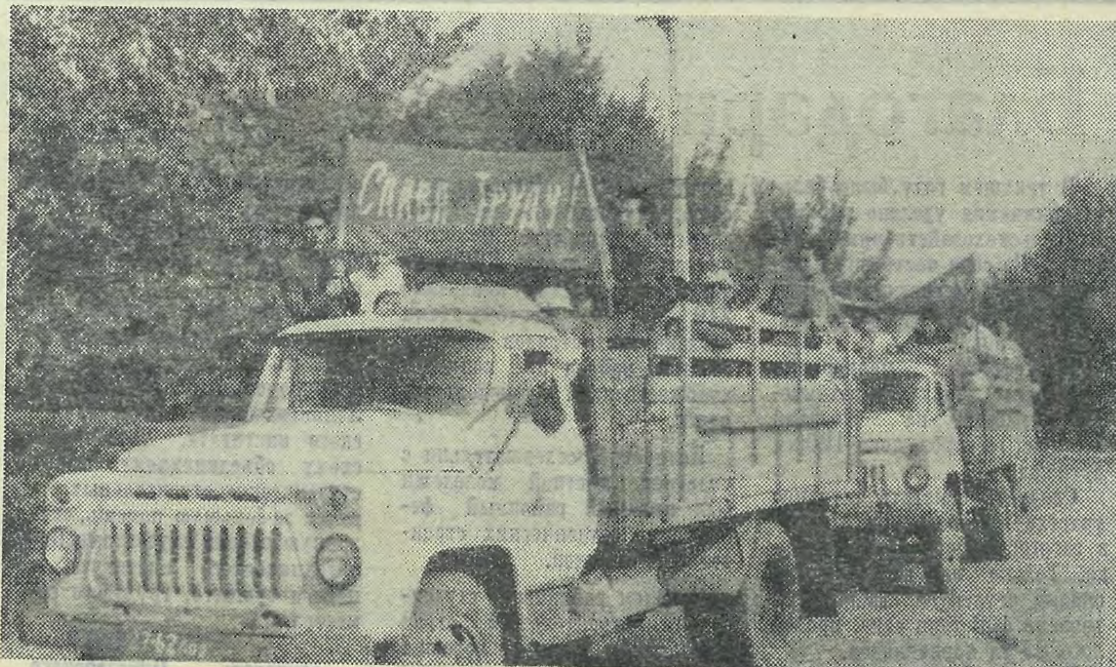
Студенты-иностранцы едут на субботах.

В интернациональном молодежном лагере с первого и до последнего дня особенно большим успехом пользовалась спартакиада «Дружба народов», в которой каждый мог принять участие по любимому виду спорта. В итоге на первом месте оказались вьетнамские студенты, показавшие себя наиболее самоотверженными и целеустремленными в волейболе, теннисе и других играх. Но в целом победила всетаки дружба между студентами разных стран.