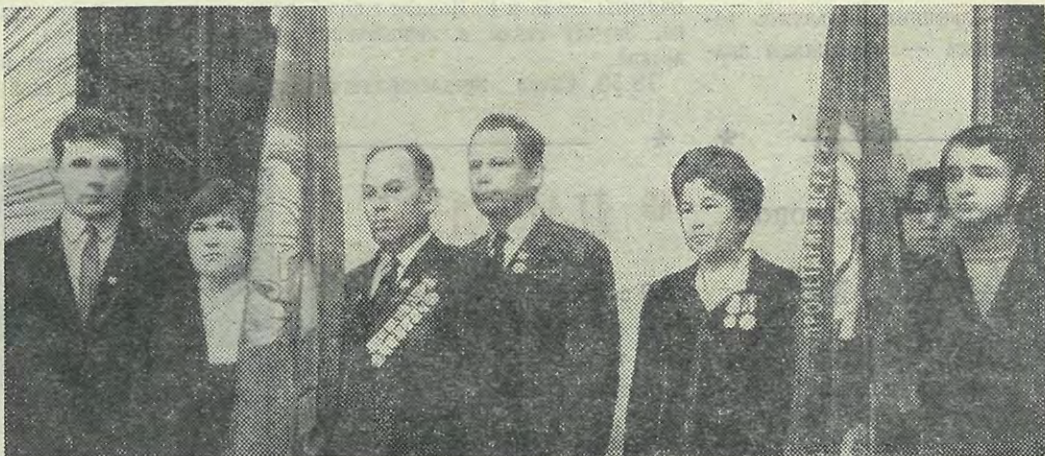
На сцене — знаменосцы: ветераны Великой Отечественной войны и первокурсники.

АКТОВЫЙ зал залит ярким светом люстр. Каждому — и тем, кто привык собираться здесь в торжественные дни, и тем, кто пришел сюда впервые, видна мемориальная доска. Надпись на ней гласит о том, что здесь звучал голос вождя пролетарской революции — Владимира Ильича Ленина.