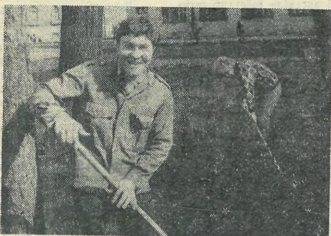
Студгородок. Работают студенты общежития ММФ.