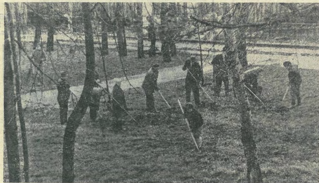
Преподаватели и сотрудники ИЭФ на уборке территории у третьего учебного корпуса.

«Коммунистические субботники» именно потому имеют громадное историческое значение, что они показывают нам сознательный и добровольный почин рабочих в развитии производительности труда, в переходе к новой трудовой дисциплине, в творчестве социалистических условий хозяйства и жизни», — так писал вождем пролетариата В. И. Ленин.