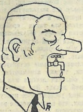
Составил Иг. ИГОРЕВ

Я — Язык. «Если у тебя есть фонтан, заткни его; дай отдохнуть и фонтану».