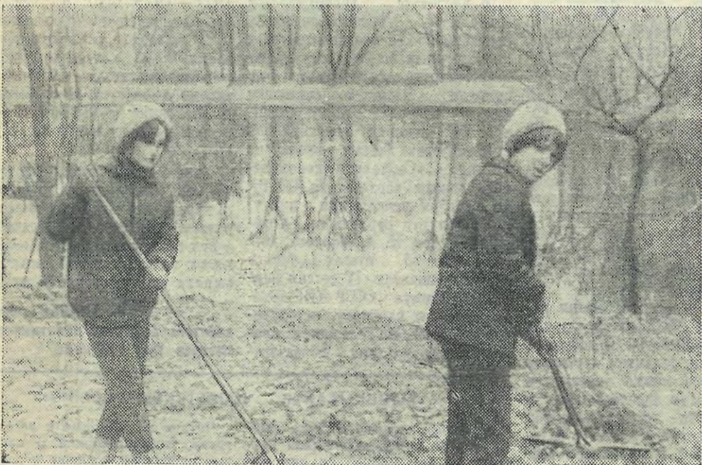
Студенты механико-машиностроительного факультета провели воскресенье в Центральном парке культуры имени С. М. Кирова.